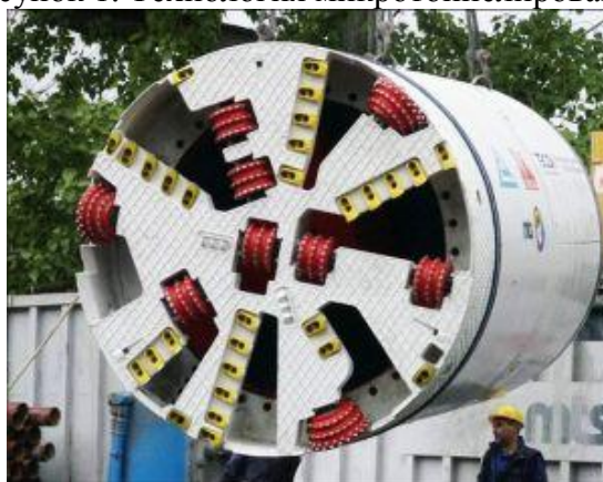
Рисунок 2. Проходческий щит

Перед началом работ проводятся подготовительные работы, включающие в себя строительство стартовой и приемной шахт на уровне ожидаемого расположения труб. Диаметры шахт не превышают нескольких метров. Затем в стартовой шахте монтируется домкратная станция и проходческий щит. Домкрат продвигает щит в грунте на расстояние, равное длине труб продавливания, и таким образом процесс повторяется. Режущее колесо машины разрабатывает породу, которая впоследствии смешивается с водой, подающейся насосом питания в зону режущих колёс, и подаётся в отстойник на поверхность шахты. Грунт, осажённый в отстойнике, вывозится, а отработанная вода вновь используется в новых циклах наращивания труб. На следующем этапе производится новое наращивание става труб, обеспечивающее проходку щита в приёмную шахту. Став труб оставляют в земле, а