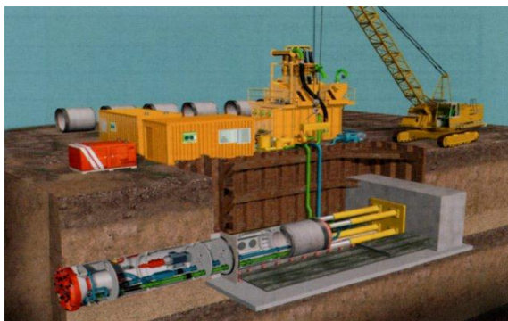
Рисунок 1. Технология микротоннелирования

Технология микротоннелирования. Проход в грунте осуществляется при помощи проходческой машины , или, другими словами, щита(проходческий щит) , который двигает домкратная станция, устанавливаемая на глубине, необходимой для прокладки трубопровода.