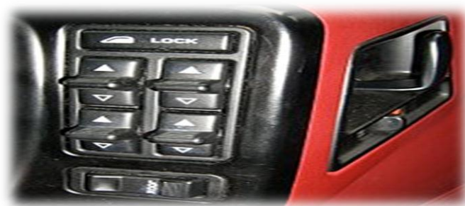
Сурет 1 – Электронды әйнек көтеру және түсірудің электронды жүйесі

Кіріспе. Терезені көтеріп-түсіру – автомашинаның негізгі құрылымы, ол есіктің бүйір терезелерін жабуға мүмкіндік береді (ол ашылғанда, әдетте есіктің ішінде жасырылады), пернені басу арқылы еш қиындықсыз, күш жұмсамай-ақ терезелерді көтеріп-түсіру өте ыңғайлы екенін білеміз. Шыны көтергіштер әдетте барлық төрт есікке (4 есікті авто модельдеріне тиесілі) немесе тек алдыңғы есіктерге орнатылады.