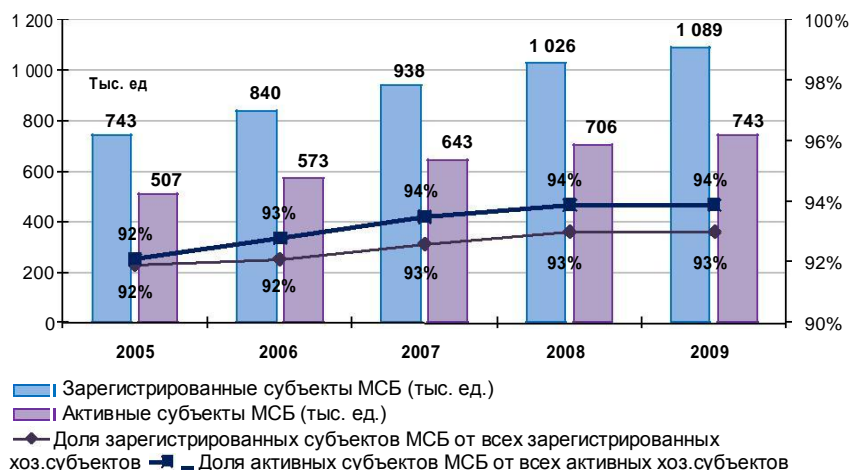
Рисунок 1 - Доля субъектов МСБ в общем количестве хозяйствующих субъектов

По данным Агентства РК по статистике число зарегистрированных субъектов МСБ в 2009 г. составила 1089 тыс. единиц, что на 32% больше по сравнению с 2005 годом. Однако доля действующих субъектов МСБ в их общем числе составила в 2009 году 68,5%, т.е. 743 тысячи, оставаясь практически неизменной на протяжении последних лет (Рисунок 1).