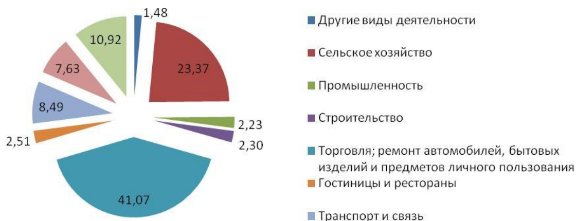
Рисунок 4 - Отраслевая структура активных субъектов МСБ по видам экономической деятельности в 2009 году, %

Сложившаяся отраслевая структура малых предприятий практически не меняется в последние годы. 41,07% функционирующих субъектов МСБ заняты в сфере торговли, 2,3% - в сфере строительства, и всего 2,23% - в сфере промышленности, что в четыре раза меньше аналогичного показателя в странах ОЭСР. Этот факт в очередной раз подтверждает, что такая тенденция развития МСБ не способствует диверсификации экономики (Рисунок 4).