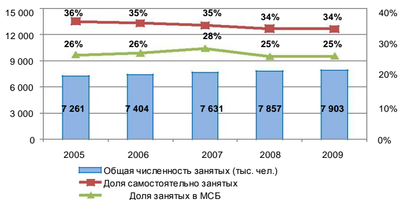
Рисунок 3 - Вклад МСБ в занятость

Сложившаяся отраслевая структура малых предприятий практически не меняется в последние годы. 41,07% функционирующих субъектов МСБ заняты в сфере торговли, 2,3% - в сфере строительства, и всего 2,23% - в сфере промышленности, что в четыре раза меньше аналогичного показателя в странах ОЭСР. Этот факт в очередной раз подтверждает, что такая тенденция развития МСБ не способствует диверсификации экономики (Рисунок 4).