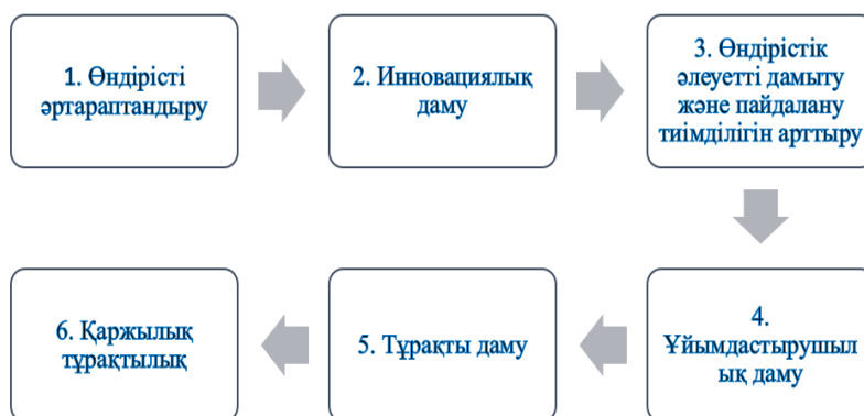
Сурет 1. Миссия мен пайымды тиімді іске асыру үшін қоғамның стратегиялық бағыттары

Миссия мен пайымды тиімді іске асыру үшін қоғам келесі стратегиялық бағыттар бойынша белсенді іс-әрекеттерді жоспарлай отырады: