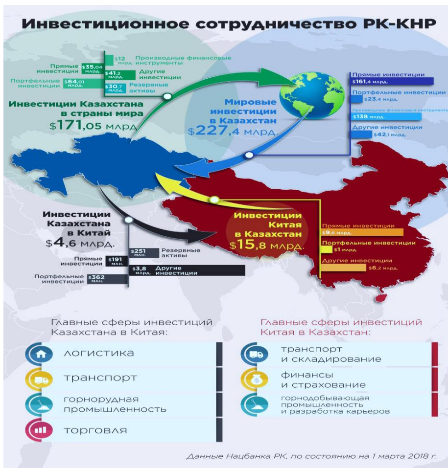
Рисунок 3 Инвестиционное сотрудничество РК - КНР [6]

Для Казахстана в экономическом отношении Китай является одним из основных партнеров, занимая 4-е место по привлеченным в нашу страну иностранным инвестициям. Основные направления сотрудничества КНР и Казахстана в рамках инициативы представлены на рис. 3.