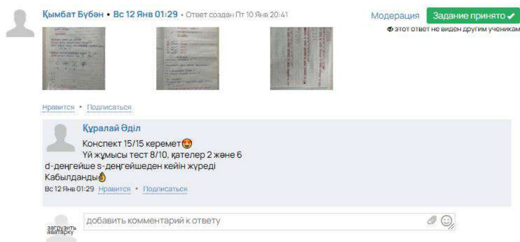
Figure 2 Feedback with the pupil on homework

In addition to the Getcourse online platform, the Google Meet platform was used to solve complex problems. Live broadcasts were also held on topics such as "Oleum", "Plates", "Tasks for Organic and Inorganic Parallel Reactions", "Product Yield", and "Mixtures".