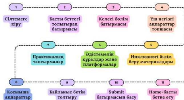
1-сурет. Қосымшаның қолданылу нұсқаулығы

Құрсақ қол жеткізу үшін суреттегі нұсқауларды орындау қажет. Қосымшаның қолданылу нұсқаулығы 1-суретте көрсетілген.