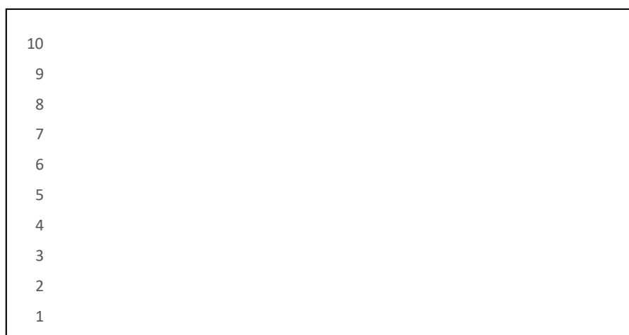
Диаграмма 1- Экспериментке дейін және кейінгі тест нәтижелері.

Ең алдымен эксперимент басында студенттерден тест алынған болатын, кейіннен нәтижені анықтау үшін қорытындылау тесті өткізілді. Бұл нәтижені 1-диаграммадан көруге болады. Эксперимент нәтижелері мобильді қосымшаны көмекші ресурс ретінде пайдалану студенттердің оқу жетістіктеріне оң әсер еткенін көрсетті.