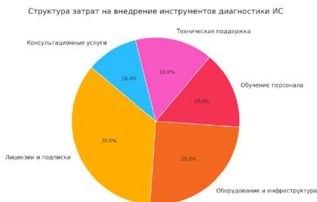
Рисунок 1. Структура затрат на внедрение инструментов диагностики ИС

Внедрение инструментов диагностики надежности информационных систем является не только технологической необходимостью, но и важным экономическим решением, влияющим на финансовые показатели организации. Затраты на их внедрение варьируются в зависимости от выбранного решения. Open-source решения, такие как Nagios Core и Zabbix, имеют низкие первоначальные затраты, но требуют значительных усилий для настройки и поддержки. В отличие от них, коммерческие системы, например, Nagios XI, Datadog или ServiceNow, предусматривают расходы на лицензии или подписку, достигающие нескольких тысяч долларов в год на каждый хост, а также требуют затрат на обучение персонала и техническую поддержку [3]. На рисунке 1 представлена примерная структура таких затрат, включающая лицензии и подписки, оборудование и инфраструктуру, обучение персонала, техническую поддержку и консультационные услуги.