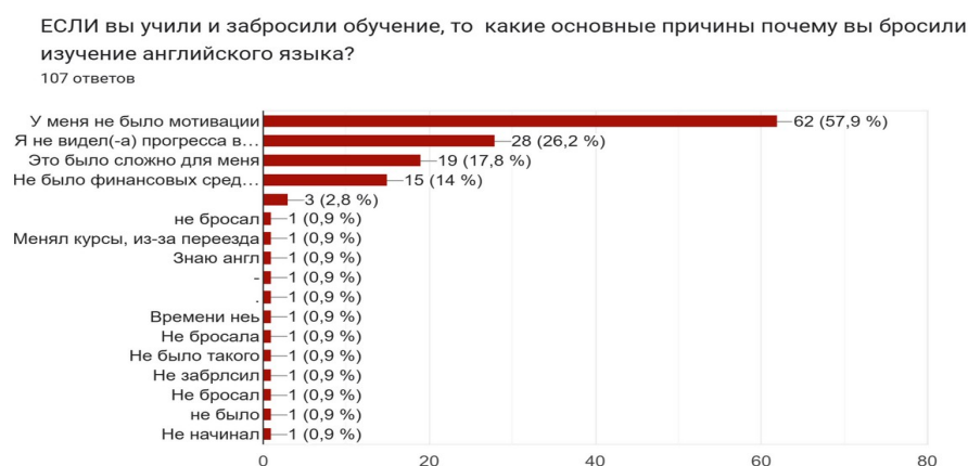
Figure 2. Reasons why students gave up learning English

The findings of the present study indicate that 76% of the student population possesses a valid and reliable understanding of their English proficiency level, ranging from A1 to C1. The research data... shows that 76% of students know their English level (from A1 to C1). When examining language skills (Speaking/Listening/Reading/Grammar/Writing), the results of this study and the survey by Alphino Susanto, A. Malik, Mitrayati Mitrayati [3, p. 6] show notable differences. According to the survey results, the most difficult language skill for ENU students is grammar (Fig. 3); approximately 34.2% of respondents identified it as the most complicated aspect, which directly addresses why many are still unable to speak English fluently. It is also important to note that listening (24.8%) and speaking (22.2%) were among the most challenging skills for students, which prevented them from being good at English.