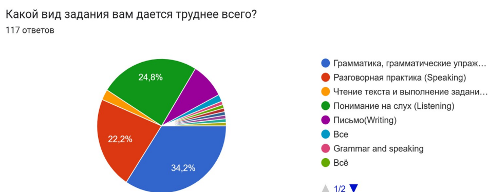
Figure 3. Language skills students find the most difficult to learn