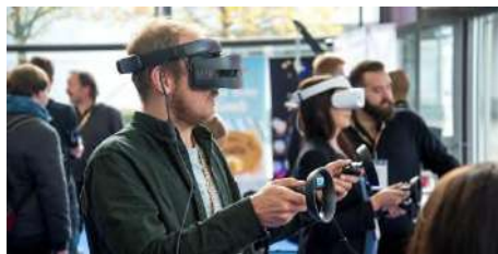
Рис.1. Человек в шлеме виртуальной реальности

помощью специальных очков или шлемов, пользователь может перемещаться и взаимодействовать с этим виртуальным миром, создавая ощущение присутствия в нем. [6].