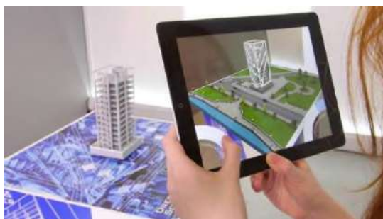
Рис.3. Визуализация фасада и инфраструктуры с использованием дополненной реальности

Визуализация проектов и дизайн является ключевым преимуществом применения технологий виртуальной и дополненной реальности (VR/AR) в строительстве. С помощью этих технологий участники проекта могут создавать трехмерные модели объектов строительства и окружающей среды, которые предоставляют более реалистичное и наглядное представление о будущем проекте. Технологии VR/AR позволяют иммерсивно погрузиться в виртуальное пространство, где они могут исследовать объекты, изменять их параметры и взаимодействовать с окружающей средой. Это обеспечивает возможность реального времени оценивать дизайн, пространственную композицию и эргономику объекта, а также вносить коррективы в проект на ранних стадиях разработки. Благодаря визуализации проектов с использованием VR/AR, архитекторы, дизайнеры и заказчики могут более точно представить себе окончательный результат. Это позволяет лучше понять особенности проектируемого объекта, учесть потребности заказчика и окончательные предпочтения, а также предотвратить потенциальные проблемы или несоответствия до начала реального строительства. Такой подход способствует улучшению качества проектирования, повышению удовлетворенности клиентов и снижению риска возникновения ошибок и дополнительных затрат на исправление в дальнейшем.