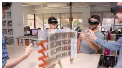
Рис.2. Совместная работа с использованием дополненной реальности

Дополненная реальность, напротив, расширяет реальное окружение пользователя, добавляя к нему виртуальные объекты или информацию. Пользователь видит реальный мир через камеру устройства (например, смартфона или очков), и на экране отображаются дополнительные элементы, которые могут быть связаны с окружающими объектами или предоставлять дополнительные данные.