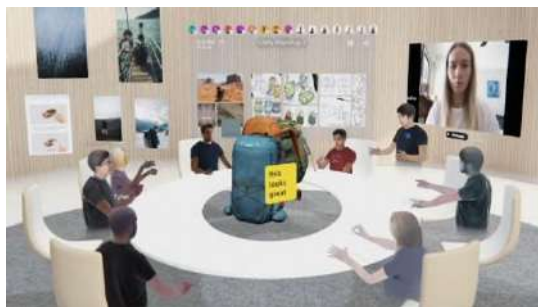
Рис.4. Пример совещания в виртуальном пространстве

между всеми участниками проекта, так как каждый может наглядно представить себе обсуждаемые концепции и вносить свой вклад в процесс. Кроме того, такая визуализация помогает устранить возможные недопонимания и конфликты, улучшая взаимопонимание и снижая вероятность ошибок на ранних этапах проектирования [7]. Улучшенное взаимодействие и коммуникация между участниками проекта благоприятно сказывается на качестве проектирования и ускоряет процесс принятия решений. Это позволяет участникам проекта лучше сориентироваться в его концепции и деталях, что в конечном итоге способствует более успешной и эффективной реализации строительного проекта.