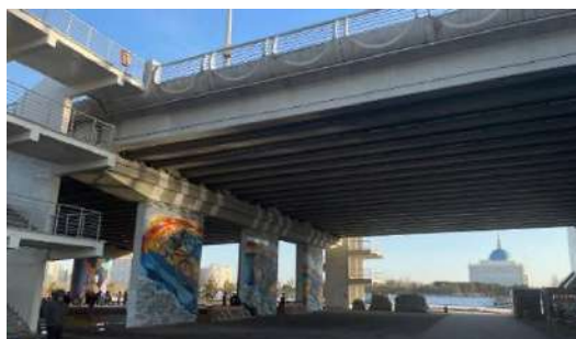
Рис.1 Мост из железобетона

различные объекты строительства: здания и сооружения, а также мосты и дороги. (рис.1-2)