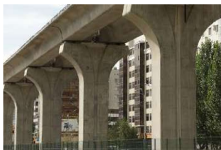
Рис.2 Открытая конструкция ЛРТ из железобетона

Когда в порах бетонной конструкции находится вода, тогда во время периода отрицательной температуры она кристаллизуется в конструкции и бетон деформируется. Это происходит из-за того, что объем воды увеличивается примерно на 10%. В бетоне увеличивается внутреннее напряжение на разрыв. Так как прочность бетона на растяжение очень низкая, замерзание воды образует в нем микротрещины. В дальнейшем при повторном замерзании воды они будут увеличиваться. При последующих циклах замораживания и оттаивания эти микротрещины постепенно увеличиваются в размерах, переходя в более глубокие и крупные повреждения. Это влияет на эстетический вид конструкции, а также на ее целостность. Если своевременно не провести необходимые ремонтные работы, конструкция может перейти в состояние, когда её восстановление станет технически невозможным или экономически нецелесообразным. В подобных случаях единственным возможным решением становится частичная или полная замена повреждённых элементов, либо конструкции в целом, поскольку дальнейшая эксплуатация сооружения с существенными дефектами значительно уменьшает работоспособность конструкции [1].