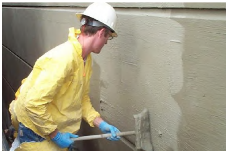
Рис.7 Нанесение обмазочной гидроизоляции

Ремонт конструкции актуален только при наличии небольших трещин. Если конструкция подверглась крупным деформациям требуется замена поврежденного элемента или полной конструкции. Только регулярное техническое обслуживание и профилактические осмотры конструкции позволяют своевременно выявлять и устранять небольшие повреждения и дефекты, способствующие дальнейшему разрушению бетона при воздействии низких температур.