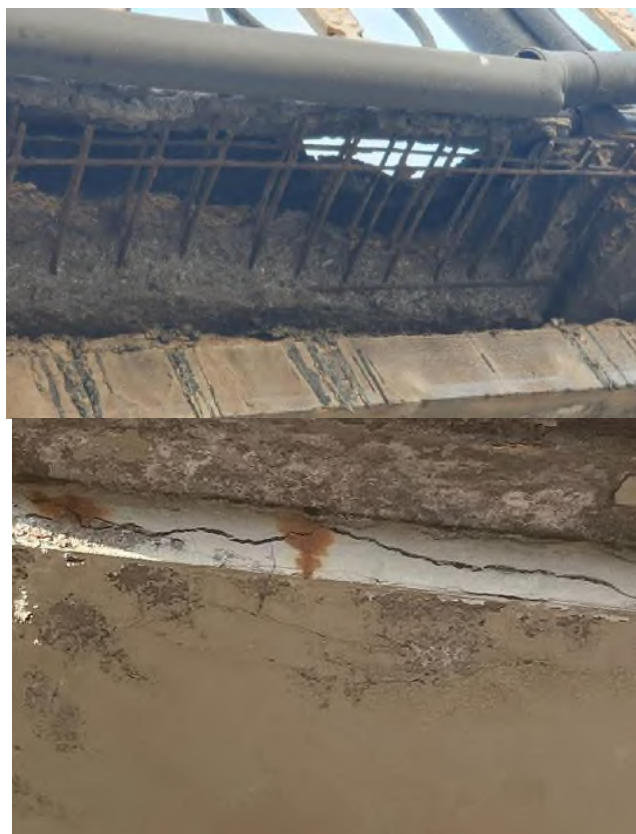
Рис.3 Оголение арматуры