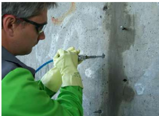
Рис.5 Инъектирование бетона

В зависимости от степени дефекта может быть использована альтернативная смесь в виде MasterEmaco N900. Это безусадочная быстротвердеющая сухая смесь, содержащая полимерную фибру. Он используется при ремонте неактивных трещин с раскрытием до 1 мм. MasterEmaco N900 - готовый к применению материал в виде модифицированной полимерами сухой смеси на основе цемента и фракционированного песка с максимальной крупностью 0,63 мм. При смешивании сухой смеси с водой образуется не расслаивающийся раствор, обладающий высокой адгезией к бетону [3].