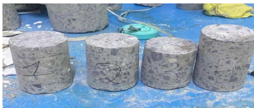
Рис 11 Керны бетона, отобранные из конструкции