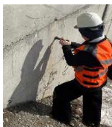
Рис.7, 8 Определение прочности бетона в конструкции ультразвуковым методом и методом ударного импульса