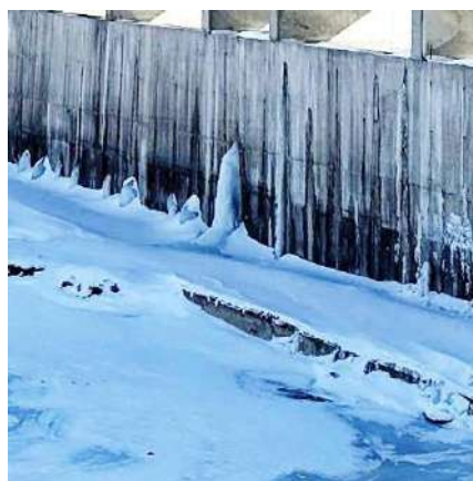
Рис.4 Участок №2