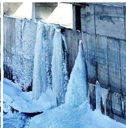
Рис.5 Участок №3