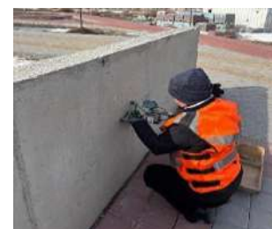
Рис 9, 10 определение прочности бетона методом отрыва со скалыванием