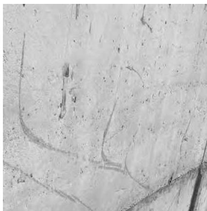
Рис.3 Участок №1

Все результаты исследований сведены в таблицу 1. Результаты измерений даны в МПа. Всего проведены испытания на каждом участке: прибором ИПС МГ4 – 12 испытаний; УКС МГ4 – 9 испытаний; ПОС 50МГ4 – 3 испытаний; керны – 4 шт. За результат были приняты средние значения.