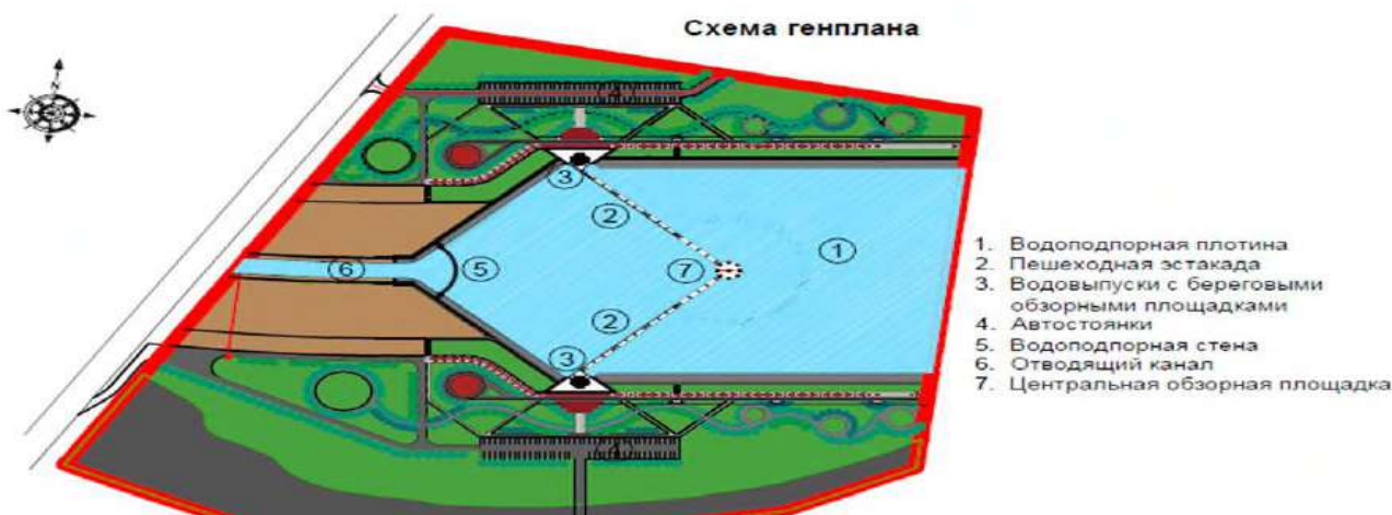
Рис.1 Схема расположения конструктивных элементов сооружения

Исследования бетона проводились на гидротехническом сооружении в г.Астана. Водорегулирующая плотина представляет собой подпорную стену сложной формы (Рис.1). В плане подпорная стена состоит из круглой части ( 3/4 круга с радиусом - 38м.) и двух диагональных частей, сопряженных с береговыми обзорными площадками. Водоподпорное сооружение состоит из водоподпорной плотины, водобойной плиты, водовыпуска, водоподпорной стены и обзорной площадки. Водоподпорная монолитная железобетонная плотина состоит из стены высотой 5,8 м и толщиной 0,75 м и фундаментной плиты, толщиной 0,9 м. Бетон принят В25, W8, F300. Плотина в плане запроектирована в виде дуги с контрфорсами (центральная часть) в сочетании с двумя прямыми частями. Возраст бетона на момент проведения испытания составлял 5 лет.