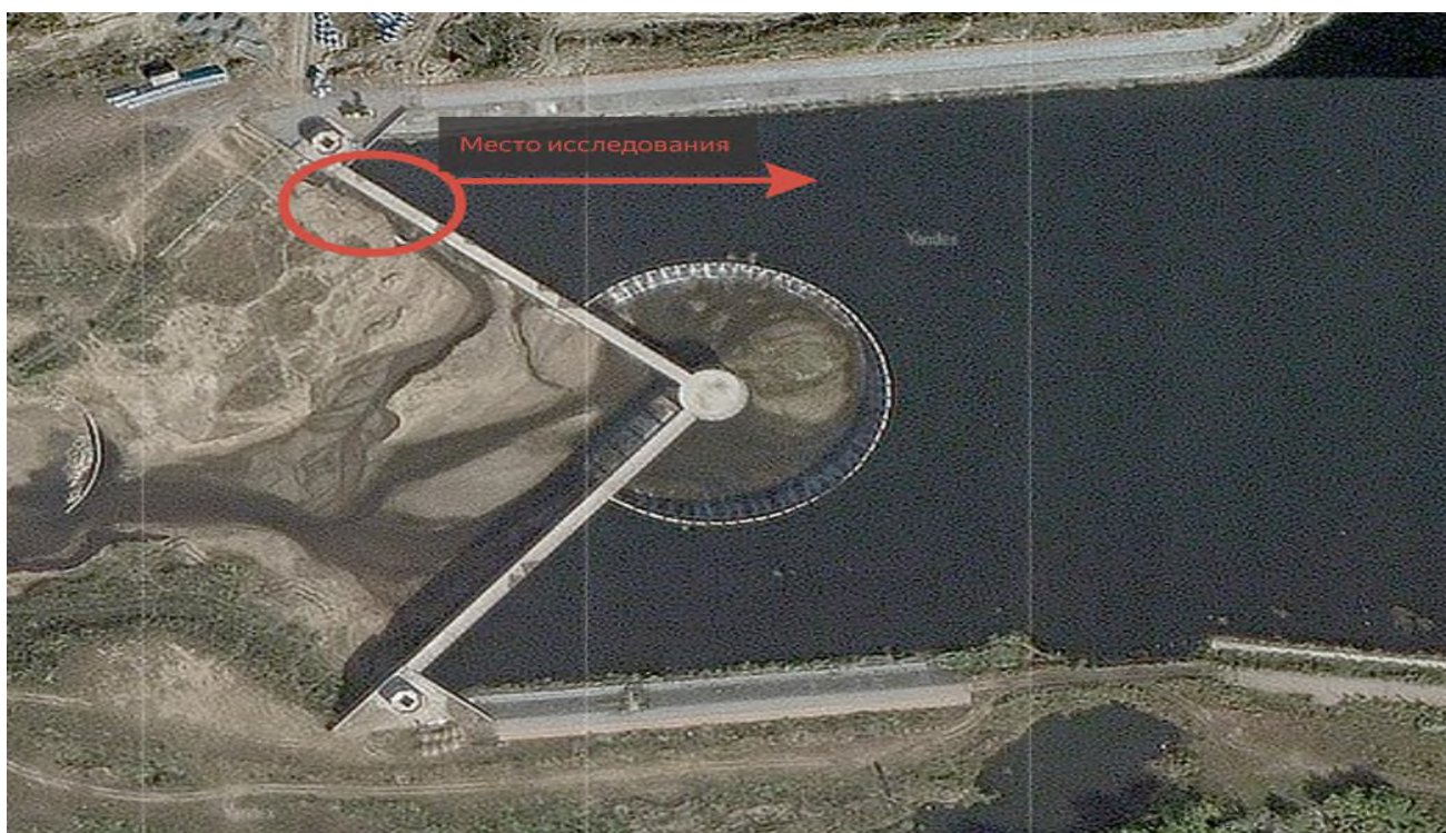
Рис.2 Снимок со спутника

Исследования бетона проводились на гидротехническом сооружении в г.Астана. Водорегулирующая плотина представляет собой подпорную стену сложной формы (Рис.1). В плане подпорная стена состоит из круглой части ( 3/4 круга с радиусом - 38м.) и двух диагональных частей, сопряженных с береговыми обзорными площадками. Водоподпорное сооружение состоит из водоподпорной плотины, водобойной плиты, водовыпуска, водоподпорной стены и обзорной площадки. Водоподпорная монолитная железобетонная плотина состоит из стены высотой 5,8 м и толщиной 0,75 м и фундаментной плиты, толщиной 0,9 м. Бетон принят В25, W8, F300. Плотина в плане запроектирована в виде дуги с контрфорсами (центральная часть) в сочетании с двумя прямыми частями. Возраст бетона на момент проведения испытания составлял 5 лет.