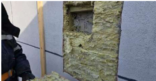
Рис.3 – Недостаточное количество дюбелей

Ошибка в креплении минераловатных плит дюбелями приводит к расслоению конструкции, что со временем вызывает появление трещин и осыпание внешнего слоя фасада. Нарушение его целостности делает утеплитель уязвимым к атмосферным воздействиям: материал намокает, увеличивается в весе, что влечет за собой серьезные повреждения и потерю теплоизоляционных свойств (Рис.3).