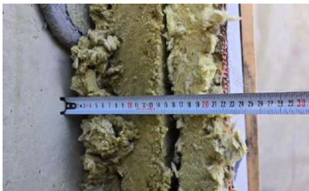
Рис.4 – Расслоение слоев утеплителя

Нарушение установленных норм толщины штукатурного слоя при фасадных работах может привести к серьезным дефектам отделки и сократить срок службы покрытия. Как чрезмерно тонкий, так и слишком толстый слой штукатурки имеют свои негативные последствия, влияющие на долговечность и эксплуатационные характеристики фасада. Слишком тонкий слой (менее 3 мм), приводит к: повышенному риску образования трещин из-за недостаточной прочности покрытия; ухудшению адгезии штукатурки к основанию, что может привести к ее отслоению; снижению устойчивости к механическим и атмосферным воздействиям, что ускоряет износ покрытия; недостаточному погружению армирующей сетки, что ослабляет армирование и снижает прочность фасадного слоя. Слишком толстый слой (более 5 мм за один проход), приводит к: неравномерному высыханию штукатурки, что увеличивает риск растрескивания; возникновению внутренних напряжений в материале, что может привести к его отслоению; увеличению нагрузки на фасад, что в перспективе может повлиять на прочность конструкции; повышенному расходу материала, что делает процесс оштукатуривания менее экономичным.