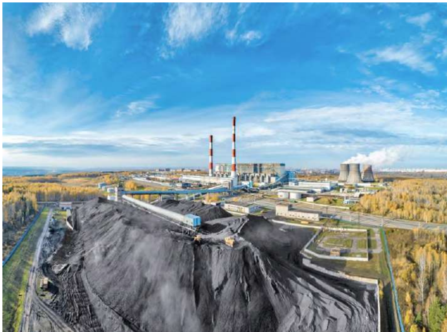
Fig 2. Fly Ash in Modern Construction Mixes

Fly ash, generated during coal combustion in thermal power plants, and related slag products are key components due to their high silica and alumina content. This results in excellent pozzolanic activity, which densifies the cement paste, reduces porosity, and enhances the corrosion resistance of concrete [5].