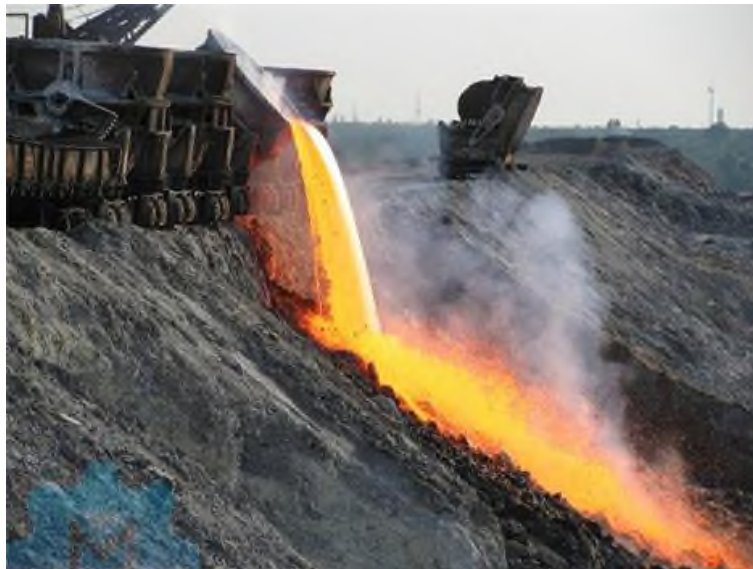
Fig 3. Metallurgical Slags