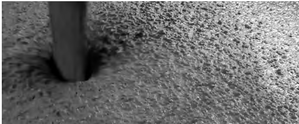
Fig 6. Self-Compacting Concrete (SCC) with Industrial Additives

In addition to individual components, there is growing interest in self-compacting concrete (SCC). In SCC, red mud (RM) can serve as a viscosity-modifying agent (VMA), while circulating fluidized bed fly ash (CFB fly ash) can act as an additional cementitious material (SCM), reducing the reliance on Portland cement and lowering the carbon footprint. This balanced approach has been shown to improve not only strength and frost resistance but also the corrosion resistance of the concrete.