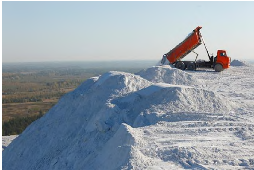
Fig 5. Phosphogypsum in Concrete Mixes

According to international research [9–10], the key to the effectiveness of these industrial wastes lies in their pozzolanic activity and compatibility with the cement matrix. Research conducted in Kazakhstan emphasizes the need for comprehensive evaluation of the long-term durability of concrete with such additives under variable temperatures, aggressive environments, and dynamic loading.