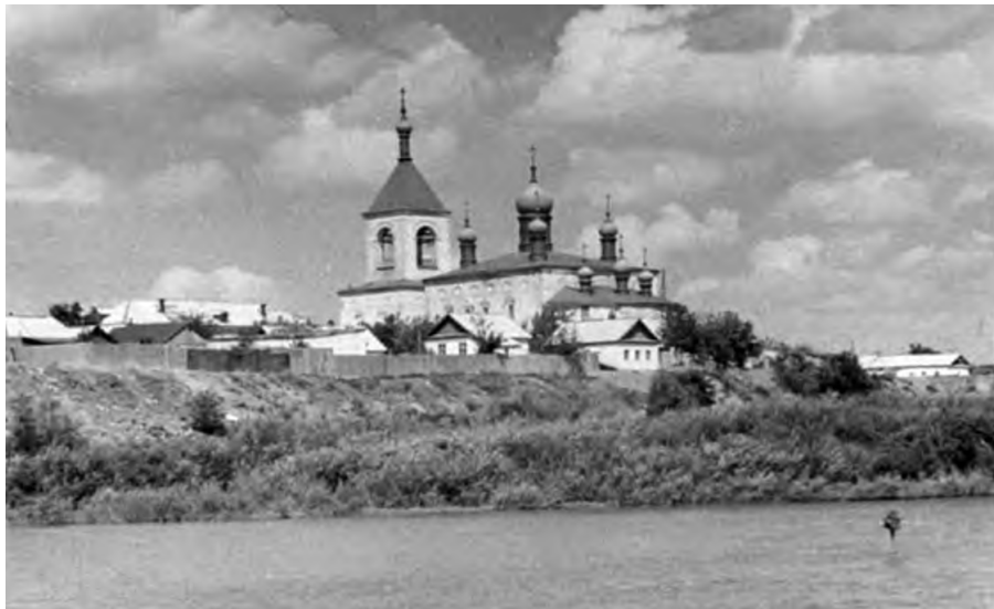
Рис.2 Вид на собор с реки Урал

Исторические источники указывают на его важную роль в формировании духовной и культурной жизни региона. В периоды политической нестабильности, включая революцию и советское время, собор претерпел значительные разрушения, но сумел сохранить свою основную структуру. (Рисунок 2) Возрождение в постсоветское время стало важным этапом в его истории, позволив восстановить утраченные элементы и вернуть объекту его первоначальное величие. [1]