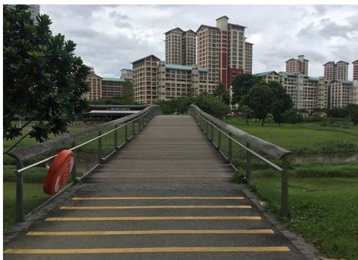
Рисунок 2 Парк «Bishan-Ang Mo Kio Park», Сингапур

Так же, в Сингапуре действуют государственные программы, направленные на улучшение доступа городской среды, такие как Enabling Masterplan и SG Enable. Стратегическая программа Enabling Masterplan, запущенная правительством направлена для улучшения доступа людей с инвалидностью к образованию, здравоохранению и общественным услугам. Вторая государственная организация помогает людям с особыми потребностями найти работу, получить доступ к технологиям и социальной поддержке.