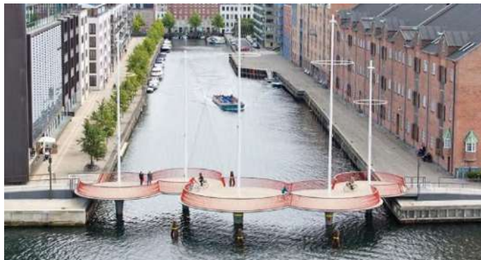
Рисунок 3 Пешеходно-велосипедный мост Cirkelbroen, Копенгаген

• В новых жилых комплексах строятся лифты и широкие дверные проемы, позволяющие комфортное передвижение маломобильных граждан. Один из примеров – пешеходно-велосипедный мост Cirkelbroen, обеспечивающий беспрепятственный переход через каналы (рис 3-4).