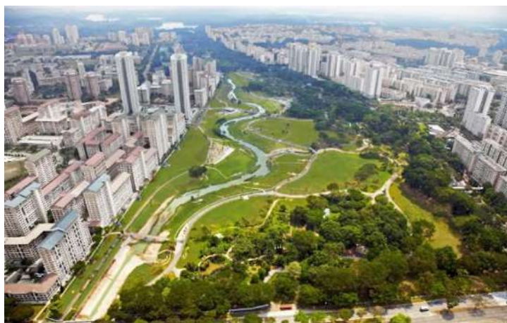
Рисунок 1 Парк «Bishan-Ang Mo Kio Park», Сингапур