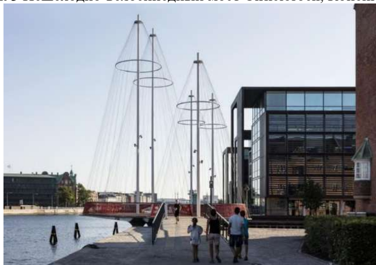
Рисунок 4 Пешеходно-велосипедный мост Cirkelbroen, Копенгаген