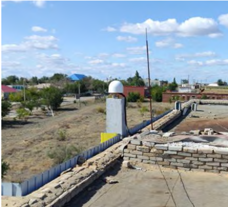
2 – сурет. PTRG(Торгай) пункті