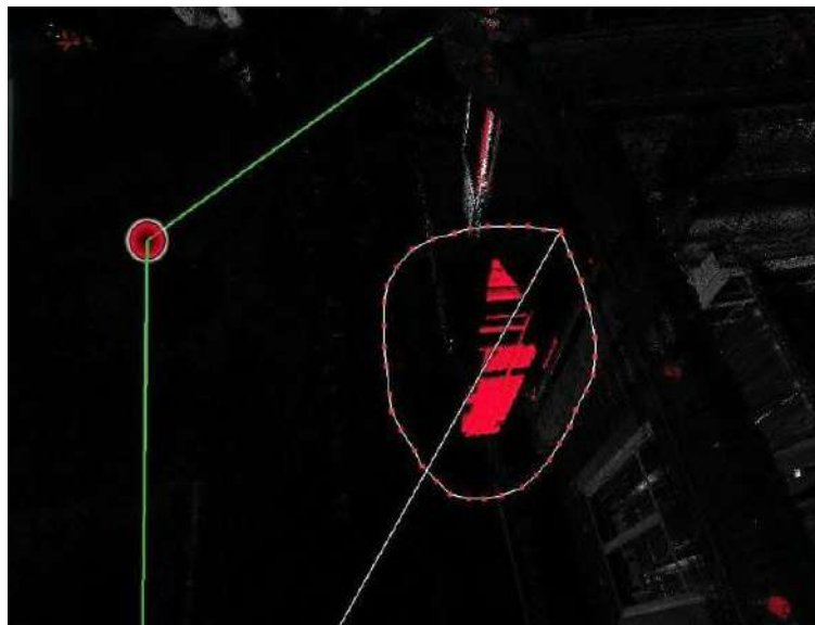
3-сурет. Артық элементтерді алып тастау процесі

Бұл суретте «Біріктіру және оңтайландыру» процесі орындалуда. Leica Cyclone REGISTER 360 PLUS бағдарламасындағы бұл мүмкіндік сканерлеу барысында алынған нүктелерді сәйкестендіріп, бір жүйеге келтіру үшін пайдаланылады. Өртүрлі позицияларда түсірілген нүктелік бұлттар бірыңғай координат жүйесіне біріктіріліп, өлшеу дәлдігі жақсарады. Автоматтандырылған алгоритмдер беткі қабат ерекшеліктері мен арнайы маркерлерді (таргеттерді) пайдаланып сәйкестендіруді жүзеге асырады. Нәтижесінде, жоғары дәлдікті 3D нүктелік бұлт түзіліп, оны құрылыс, инженерлік зерттеу және сәулет салаларында пайдалануға мүмкіндік береді.