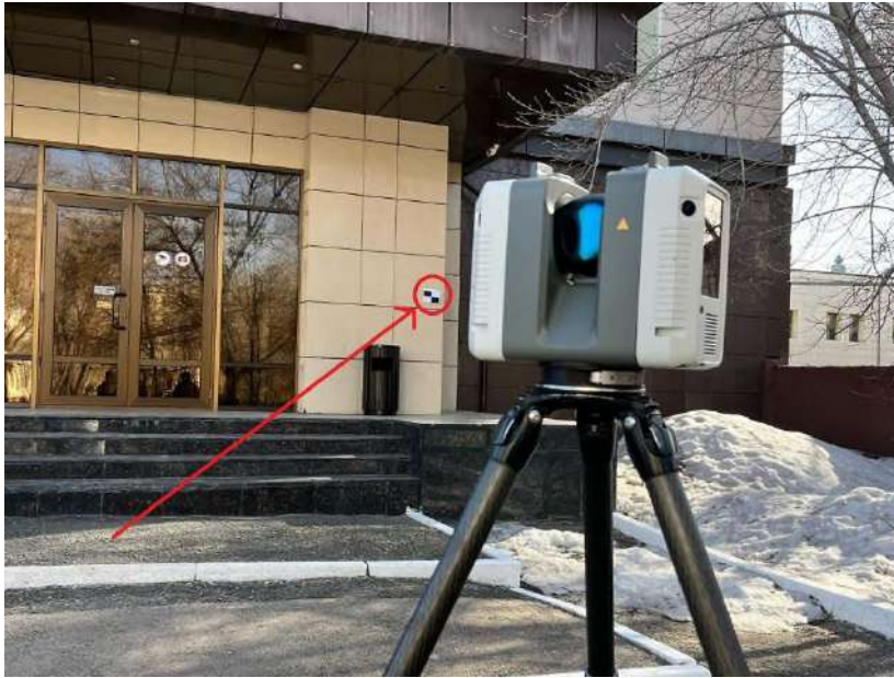
1-сурет. Leica RTC360

Leica RTC360 – жоғары дәлдікті портативті 3D лазерлік сканер, ол ішкі және сыртқы кеңістіктерді сканерлеуге арналған. Бұл құрылғы инерциялық жүйемен жабдықталған және бұлт-нүктелерді автоматты түрде біріктіру функциясына ие. Оның жұмыс радиусы 130 метрге дейін, ал сканерлеу жылдамдығы секундына 2 000 000 нүктеге дейін жетеді. IP54 стандартына сәйкес қорғаныс деңгейіне ие. Бұл – интеллектуалды әрі жылдам сканерлеуді қамтамасыз ететін ең озық технологиялардың бірі.