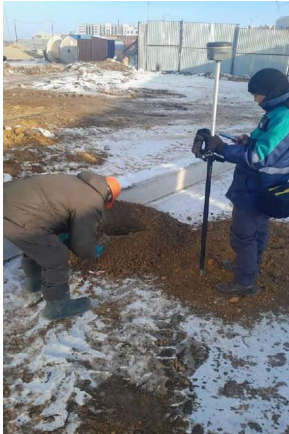
Сурет-1 GNSS құрылғы көмегімен свайға белгі беру барысы

Тахеометр – құрылыс және геодезия саласында кеңінен қолданылатын дәлдік құралдарының бірі. Ол жергілікті жердің координаттарын анықтауға, қашықтық пен биіктікті өлшеуге және құрылыс алаңында белгілеу жұмыстарын жүргізуге мүмкіндік береді. Қазіргі заманғы тахеометрлер цифрлық технологиялармен жабдықталып, деректерді автоматты түрде өңдеуге және сақтауға мүмкіндік береді [1].