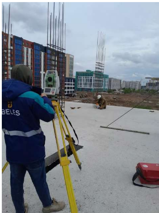
Сурет-2 Тахеометр құрылғы арқылы орын белгілеу жұмыстары

Қорытынды Көпқабатты тұрғын үй кешендерін салу кезінде жүргізілетін геодезиялық жұмыстар құрылыс сапасын арттырып, қауіпсіздікті қамтамасыз етеді. Астана мысалында көрсетілгендей, құрылыс алаңын жан-жақты зерттеу, инженерлік желілер мен инфрақұрылымды үйлестіру – қала құрылысының сәтті жүргізілуінің маңызды факторы болып табылады. Осылайша, қазіргі заманғы геодезиялық технологияларды қолдану урбанистикалық даму мен экологиялық тұрақтылықты сақтауға мүмкіндік береді.