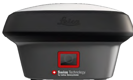
Сурет 2 GS18I қабылдағышы

Осы екі қабылдағышты пайдаланып Астана қаласында өлшеу жұмыстары жүргізілді. Өлшеу RTK режимінде, Астана қаласының жергілікті координатасында жүргізілді. Базалық станция ретінде Назарбаев Университетінде орналасқан база пайдаланылды. Өлшеу нәтижелері кесте 2 жазылған.