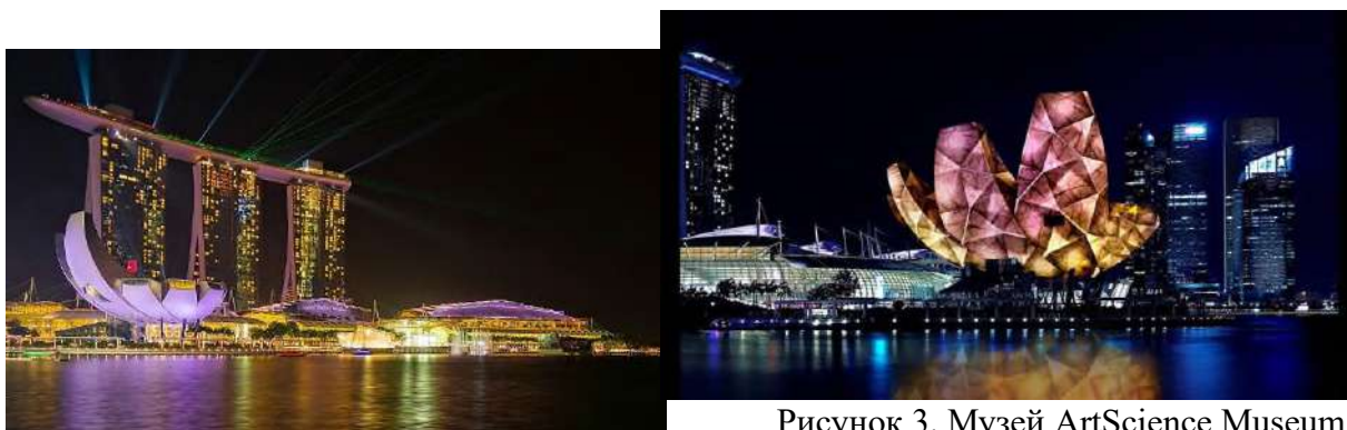
Рисунок 3. Музей ArtScience Museum в Сингапуре.

Примером использования технологий динамичного света и формы в архитектуре является в Сингапуре ArtScience Museum. Это здание, спроектированное архитекторами Норманом Фостером и Кена Ёкаямой, представляет собой архитектурное чудо, которое сочетает в себе искусство и науку. Его форма напоминает распускающийся цветок лотоса, что придает зданию органичный и природный вид, но также играет важную роль в восприятии света. Стеклопленочные поверхности крыши пропускают естественный свет, который наполняет интерьер мягким светом, создавая игру света и тени. Этот эффект особенно заметен в дневное время, когда естественный свет проникает через стеклопленочную кровлю и меняет атмосферу внутри здания. Вечером, когда дневной свет уходит, искусственная подсветка начинает акцентировать внимание на архитектурной форме здания, придавая ему особую ночную атмосферу, которая выделяет музей в городской среде (Рисунок 3).