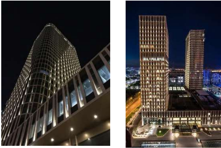
Рисунок 6. Талан Тауэр в Астане.

Сегодня архитекторы стремятся найти баланс между активным визуальным восприятием и ощущением спокойствия. Природные палитры, мягкие текстуры и тактильные поверхности создают атмосферу, в которой человек может сосредоточиться и чувствовать себя в безопасности. В условиях растущего интереса к устойчивому проектированию и человекоцентричному подходу архитектура научных зданий становится не просто фоном для работы, а важной частью образовательного и исследовательского процесса. Пространства больше не являются просто оболочкой для научных исследований, они становятся динамичными средами, которые формируют мышление, способствуют обмену знаниями и внутренней мотивации.