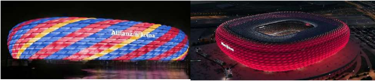
Рисунок 4. Арена Allianz Arena в Мюнхене

Еще одним примером является Национальный центр исполнительских искусств в Пекине, который представляет собой уникальное архитектурное произведение. Его фасад выполнен из отражающих материалов, а подсветка создаёт эффект зеркального отражения, благодаря чему здание как бы сливается с водой, окружающей его, создавая впечатление, что оно плавно встраивается в водную поверхность и городской ландшафт. Внешняя оболочка центра освещается по ночам, и это подчёркивает эффект отражения, благодаря чему здание становится частью окружающего пространства, а не просто элементом в нём (Рисунок 5).