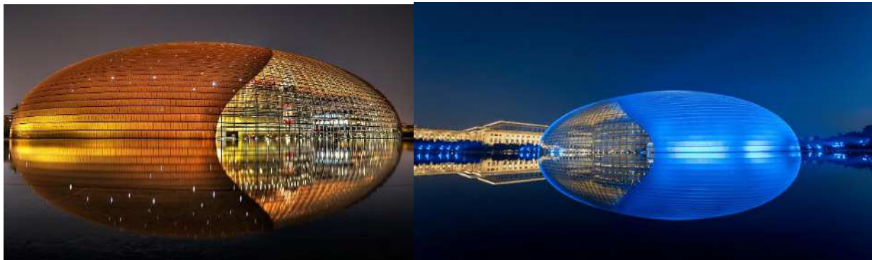
Рисунок 5. Национальный центр исполнительских искусств в Пекине

Еще одним примером является Национальный центр исполнительских искусств в Пекине, который представляет собой уникальное архитектурное произведение. Его фасад выполнен из отражающих материалов, а подсветка создаёт эффект зеркального отражения, благодаря чему здание как бы сливается с водой, окружающей его, создавая впечатление, что оно плавно встраивается в водную поверхность и городской ландшафт. Внешняя оболочка центра освещается по ночам, и это подчёркивает эффект отражения, благодаря чему здание становится частью окружающего пространства, а не просто элементом в нём (Рисунок 5).