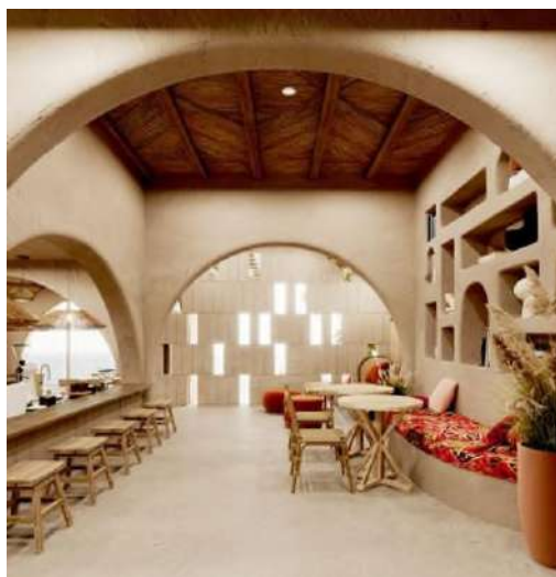
Рисунок 1 Пример интерьера с элементами традиционной казахской архитектуры

Важно, чтобы каждая деталь среды была направлена на создание атмосферы, способствующей развитию внутренней гармонии и гордости за родную культуру. Архитектурные решения должны интегрировать элементы традиционной казахской архитектуры, такие как резные деревянные панели, витражи с казахскими орнаментами и юртообразные формы, с современными технологическими решениями, что будет способствовать гармоничному сочетанию прошлого и будущего. Это пространство должно стать местом, где ученицы смогут не только обучаться, но и развивать чувство принадлежности к своей культуре и традициям.