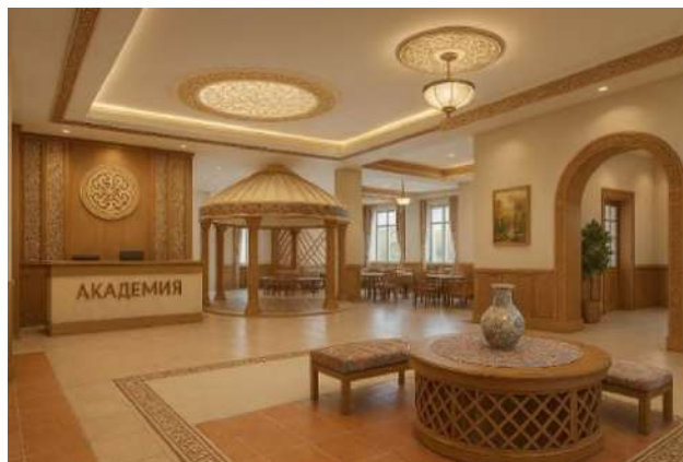
Рисунок 2 Пример интерьера среды с юртообразными формами

Ключевым аспектом в создании образовательного пространства является использование традиционных элементов, которые выполняют не только декоративную, но и символическую функцию. Резные деревянные панели и витражи с казахскими орнаментами, оформляющие стены и оконные проемы, служат напоминанием о многовековой истории народа, его уникальном искусстве и традициях (Рисунок 2).