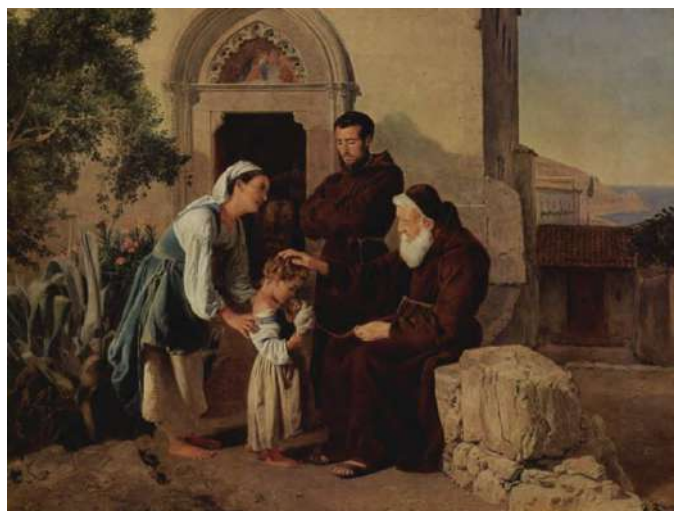
Рис.1. Картина принятия ребенка в религиозную общину

Архитектура детских домов отражает не только развитие строительных технологий, но и изменения в обществе, его отношении к детям, понимании их потребностей и прав. В разные эпохи подходы к оформлению и организации таких учреждений были различными, что в особенности отразилось в архитектуре, изменения которой характерно наблюдается по сей день.