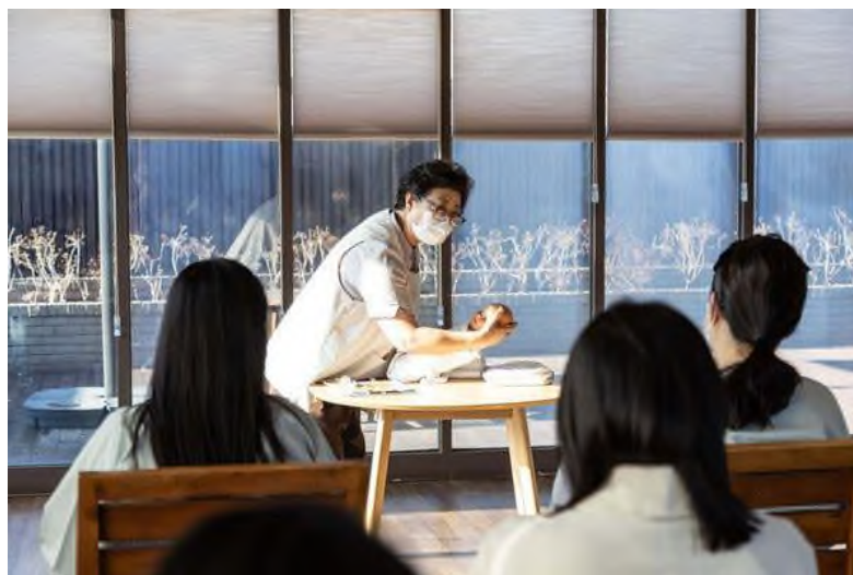
Рисунок 1 St.Park в Корее

Молодые матери записываются в такие центры не только для получения поддержки после родов, но и для общения с другими мамами, чьи дети того же возраста.