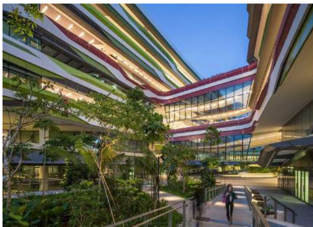
Сурет – 2. Singapore University of Technology and Design корпусының биофильді дизайны

шығармашылыққа ынталандыруға мүмкіндік береді. Жасыл кеңістіктер тек эстетикалық мақсатта ғана емес, экологиялық тұрақтылықты қамтамасыз етуде маңызды рөл атқарады. Мысалы, өсімдіктер ауа сапасын жақсартады, артық жылуды сіңіріп, сыртқы шуды азайтады [2]. Бұл студенттердің жоғары деңгейде жұмыс істеп, өздерінің шығармашылық қабілеттерін дамытуына ықпал етеді. Университеттің интерьері мен архитектурасында биофильді дизайн принциптері кеңінен қолданылып, табиғат пен технологияның үйлесімі ұтымды түрде енгізілген. Шығармашылық бағыттағы жоғары оқу орындарының ішкі озеленуі бүгінгі таңда білім беру кеңістігін қайта қалыптастырудың маңызды бөлігіне айналды. Әлемнің түрлі елдерінде жасыл желектер мен табиғи элементтерді тиімді қолдану студенттердің шығармашылық қабілеттерін арттыруға, оқу процесінің өнімділігін жақсартуға және психоэмоционалдық жайлылықты қамтамасыз етуге мүмкіндік береді. Биофильді дизайн студенттер мен оқытушылардың табиғатпен байланысын нығайтып, олардың шығармашылық ойлауын ынталандырады [2].