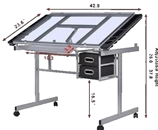
Сурет – 3. Шығармашылық бағыттағы студенттер үшін функционалды үстел

арқылы шығармашылық жұмыс барысындағы жаңа тәсілдерді ұсынады. Олардың көмегімен студенттер шығармашылық жобаларын нақты уақытта талқылап, бірге жұмыс істей алады. Қазіргі таңда білім беру мекемелерінде трансформерлік жиһаздың қолданылуы оқу үдерісінің өзара әрекеттесуін жеңілдетіп, шығармашылық дамуды қолдайды. Функционалды үстелдер мен пультті парталар оқу процесін эстетикалық жағынан да байытады. Бұл жиһаздар оқу процесінде студенттерге еркін қозғалыс жасауға мүмкіндік береді, олардың материалдармен жұмыс істеу тәсілдерін жақсартады, сонымен қатар кеңістіктегі жеке және топтық жұмысты үйлестіруге жағдай жасайды (Сурет -3).