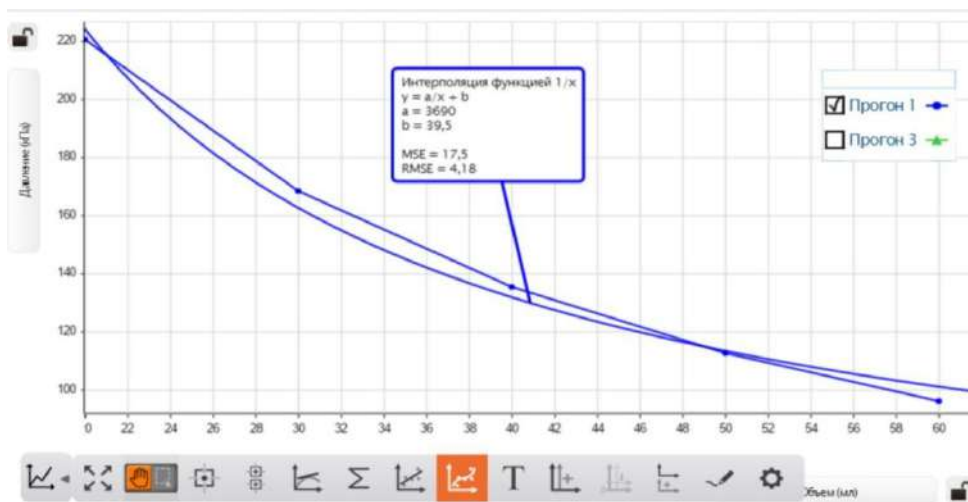
Сурет 2: Қысымның көлемге тәуелділігі

Бұл идеалды газ заңына тікелей қатысты: PV = \eta RT .