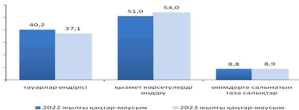
Сурет 1 – Шағын және орта кәсіпкерлік бөлінісінде ЖІӨ-дегі ШОК үлесі Ескерту – Әдебиет негізінде құралған [4]

Кәсіпкерлікті дамытудың негізгі көрсеткіштерінің бірі олардың елдің жалпы ішкі өніміндегі (бұдан әрі – ЖІӨ) үлесі болып табылады. Қазақстан Республикасы Ұлттық экономика министрлігі Статистика комитетінің (бұдан әрі – Қазақстан Республикасы Статистика комитеті) мәліметтері бойынша жоғарыда аталған көрсеткіш өсу қарқының көрсетіп отыр. Жалпы ішкі өнімдегі шағын және орта кәсіпкерлік субъектілерінің қызметінің үлес салмағы өсуі, ШОК дамуының белсенділігін арттыру шаралары бойынша мемлекет алдындағы маңызды тапсырмалардың бар екендігін көрсетті. ШОК экономикалық белсенділігінің артуына негіз болған арнайы салалық бағытталған мемлекеттік шағын орта кәсіпкерлік субъектілерін қолдауға арналған бағдарламалар іске қосылды. Шағын және орта кәсіпкерлік бөлінісінде ЖІӨ-дегі ШОК үлесі келесі суретте берілген.