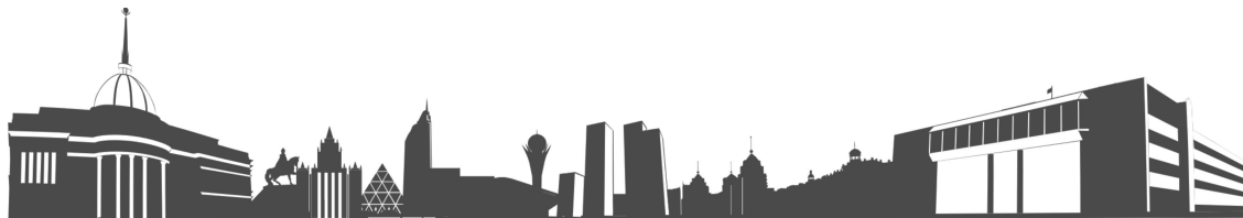
Рисунок 6 – Название рисунка

Для ссылок на утверждения, формулы и т. п. можно использовать метки. Например, теорема 2, Формула (1)