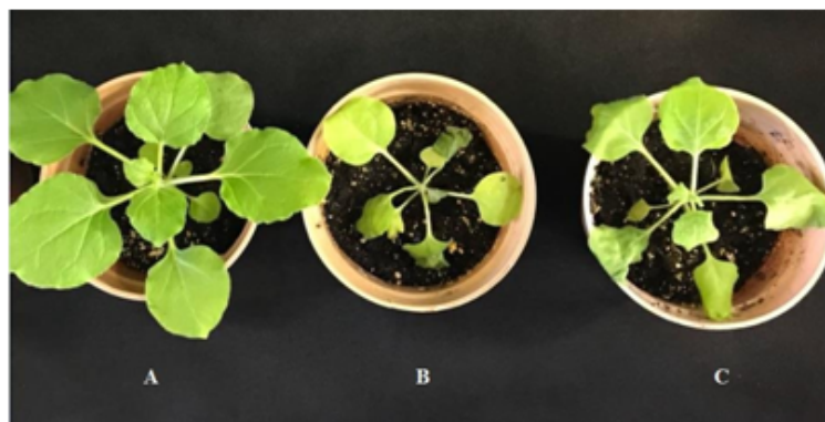
FIGURE 1 – The effect of TBSV infection on symptoms development in N. Benthamiana . (A) Healthy plant, (B) inoculated with Wt TBSV plant at 1 week postinoculation, (C) inoculated with \Delta 19 TBSV at 1 week postinoculation

N. benthamiana plants infected with TBSV wild type and its mutant type without P19 ( \Delta P19 TBSV) transcripts developed typical severe symptoms at 1 week post inoculation (Fig. 1 B, C). Visual investigation of infected plants disclosed morphological signs of viral infection: significant retardation in growth, visible damage of tissues, withering of leaves and apical necrosis [5]. Usually the plants which was infected by TBSV grew weaker of at 2 weeks post inoculation than plants was infected by \Delta 19 TBSV transcripts.