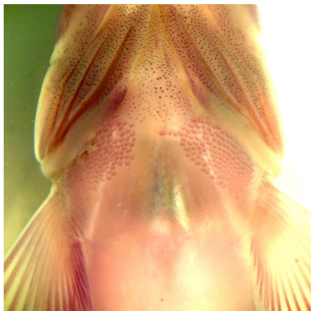
Рисунок 2 – Полоски чешуй на горле обыкновенного гольяна из р. Иртыш (Восточный Казахстан)

Вдоль нижней границы жаберных лучей, впереди оснований грудных плавников, располагаются две полосы, состоящие из рядов очень мелких неналегающих чешуй (рисунок 2).