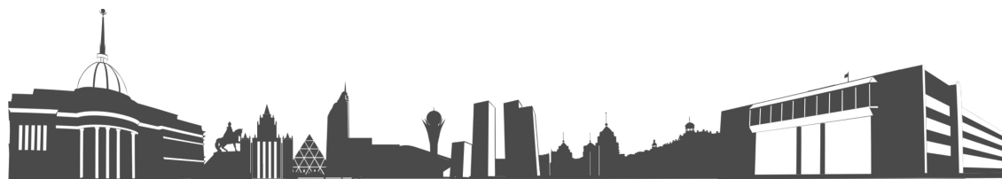
Рисунок 1 – Title of figure

Figures must be saved individually and separate to text. All figures must be numbered in the order in which they appear in the article (e.g. figure 1, figure 2). In multi-part figures, each part should be labeled (e.g. figure 1(a), figure 1(b)). Figures must be of sufficiently high resolution (minimum 600 dpi). It is preferable to prepare figures in black-and-white or grey color scale. Figures should be clear, clean, not scanned (PS, PDF, TIFF, GIF, JPEG, BMP, PCX).