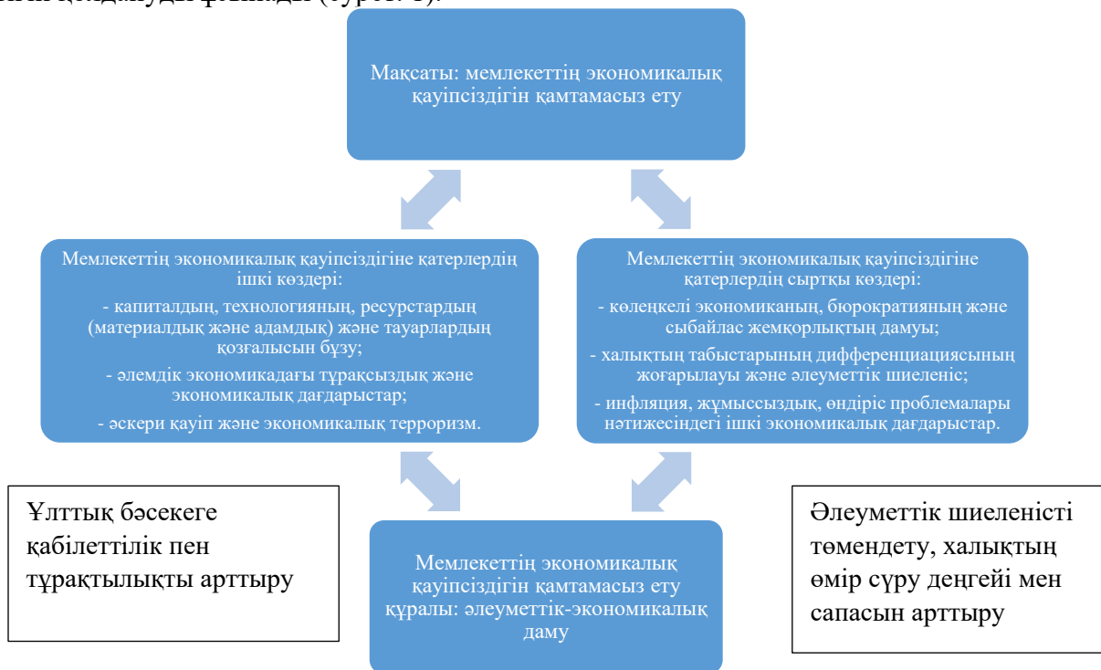
Сурет 1. Жаһандану жағдайында экономикалық қауіпсіздікті қамтамасыз етудің кешенді тәсілін жүзеге асыру механизмі

Аталған мәселелерді шешу үшін осы зерттеушілер жаһандану жағдайында экономикалық қауіпсіздікті қамтамасыз етудің кешенді тәсілін іске асырудың келесі тетігін қолдануды ұсынады (сурет. 1).