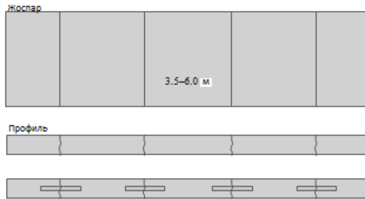
1-сурет. Біріктірілген жазық бетон төсемдер (JPCP)

Жол төсемі жоғары жылдамдықтағы көліктермен ауыр тиелген кезде, толтырғыш уақыт өте келе тозып, жабынның қызмет ету мерзімінде жарықшақтардың алдын ала алмайды. Бұл жағдайда жүктемені беру үшін тігіс бойымен түйіспелі штангалар орнатылады. Түйіспелі штангалар тегіс шыбықтар болып саналады, әдетте қарапайым немесе эпоксидті жабынмен қапталған болат, қарсылықсыз қосылыстарды ашу және жабу үшін бір жағынан майланған немесе майланған. Таяқшалар мен өзектердің екі маңызды қызметі бар. Біріншіден, іргелес жабындарда дифференциалды тік қозғалысты болдырмау үшін қолданылады немесе ақаулардың пайда болуын, екіншіден, олар көлденең қозғалысты қамтамасыз етеді, осылайша тігістер зақымданбай ашылып, жабылуы мүмкін.