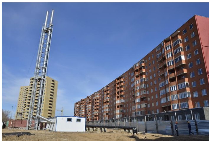
Рисунок 3. Процесс строительства социально-бюджетного жилья ЖК «Жетэ жол» в г. Астана

Эффективность использования пространства также несет большую ответственность. Социально-бюджетное жилье в городе Астана обычно строится с учетом оптимального использования пространства (Рис. 4).