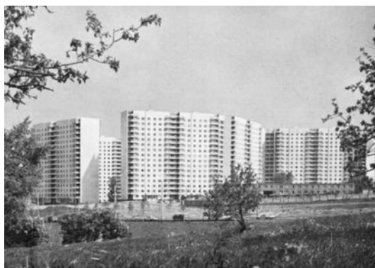
Рисунок 2. Олимпийская деревня в Москве

В этот период стали активно проводиться конкурсы на разработку многоэтажных жилых домов/комплексов (ЖК) с развитой системой социально-бытового обслуживания. Складывались основные приемы проектирования. Было выявлено, что комплексный метод застройки жилых территорий создает значительные преимущества в организации жилой среды, обслуживания населения, осуществления благоустройства и инженерного оснащения территории и всего метода строительства в целом. Примером многоэтажного жилого комплекса этого периода является ЖК «Лебедь» в Москве. Но эта практика осталась единичной. Основным структурным элементом застройки селитебных территорий в городах СССР были микрорайоны и жилые районы, в основу которых был положен принцип многоступенчатого районирования и стандартизированной системы КБО [5].