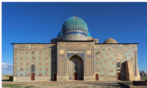
Рис. 1 Мавзолей Ходжи Ахмеда Ясауи

В-третьих, культурное наследие Казахстана имеет экономическое значение. Традиционные ремесла страны, такие как вышивка, ткачество и керамика, высоко ценятся и пользуются спросом как у коллекционеров, так и у туристов. Кроме того, традиционная кухня Казахстана, в состав которой входят блюда, приготовленные из мяса, молочных продуктов и злаков, набирает популярность во всем мире.