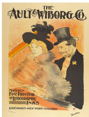
Рис. 3 Рекламный плакат компании «Ault & Wiborg Co.»

Роль плаката в жизни человека поистине огромна. В качестве средства массовой коммуникации плакаты использовались и в мирных, и в военных целях; с их помощью рекламировались и продвигались как товары массового потребления и политические баталии, так и пропагандистские идеи [2]. Если же посмотреть на плакаты как на произведения искусства, то это, конечно же, яркий образец популярного искусства, столь любимого и востребованного в дизайнерской среде. В наше время много огромного количества сменяющих друг друга событий, статей и выставок, посвященных дизайну плакатов, в мире встречаются немало энтузиастов, трепетно коллекционирующих и ценящих плакаты на вес золота. Эта классическая форма графического дизайна, кстати, незначительно изменившаяся за прошедшие столетия, так же важна и влиятельна сегодня, как и многие века тому назад.