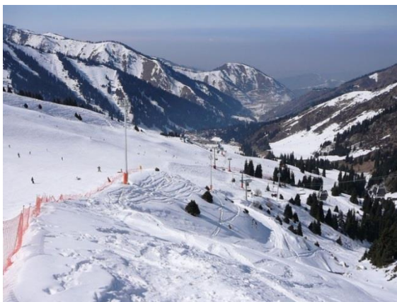
Сур. 3 Табаған туристік базасы

Табаған – Қазақстандағы ең ойластырылған тау шаңғысы курорты. Оның бірегейлігі ұсынылған мерекенің күрделілігіне байланысты аймақтарға бөлуде жатыр. Мұнда жаңадан шыққан шаңғышы кәсіпқой спортшыдан сүрінбейді, ал кәсіпқой жаңадан бастағанды құлатпайды. Табаған – Алматыға ең жақын демалыс орны: олардың арасындағы қашықтық небәрі 17 шақырым. База ұлттық қорық аумағында орналасқан, дәл осы жерде сіз табиғаттың сұлулығын тамашалай аласыз. Әрине, межелі жерге жетудің ең оңай жолы - Алма-Атадан, трансферге алдын ала тапсырыс беру арқылы ол туристік автобус немесе таксидегі орын болуы мүмкін, бұл әлдеқайда қымбатқа түседі. Кешен кешке дейін жұмыс істейді. Әсіресе түнгі шаңғы тебу танымал. Түнде тау әсемдігін тамашалау үшін мұнда әлемнің түкпір-түкпірінен туристер келеді [3].