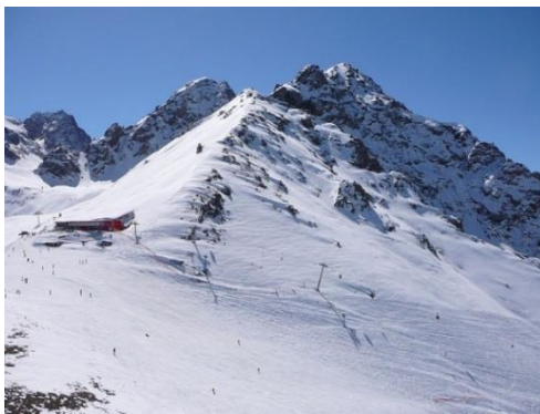
Сур. 1 Шымбұлақ курорты

Шымбұлақ – Алматы қаласынан 25 км қашықтықта орналасқан Қазақстандағы шағын курорт, 10 суретте көрсетілген. Шаңғы мектептері, коньки тебу алаңдары, қар саябақтары, әртүрлі қиындық деңгейіндегі шаңғы трассалары, балалар ойын-сауық кешендері, дүкендер, қонақ үйлер, мейрамханалар, СПА және тағы басқалары курорттың салыстырмалы түрде шағын аумағында орналаса алатындығымен ерекшеленеді. Жұмсақ климат оны тартымды етеді: Шымбұлақта суық қыс жоқ, соған қарамастан мұнда шаңғы маусымы алты айдан астам уақытқа созылады: қарашадан мамырға дейін [1].