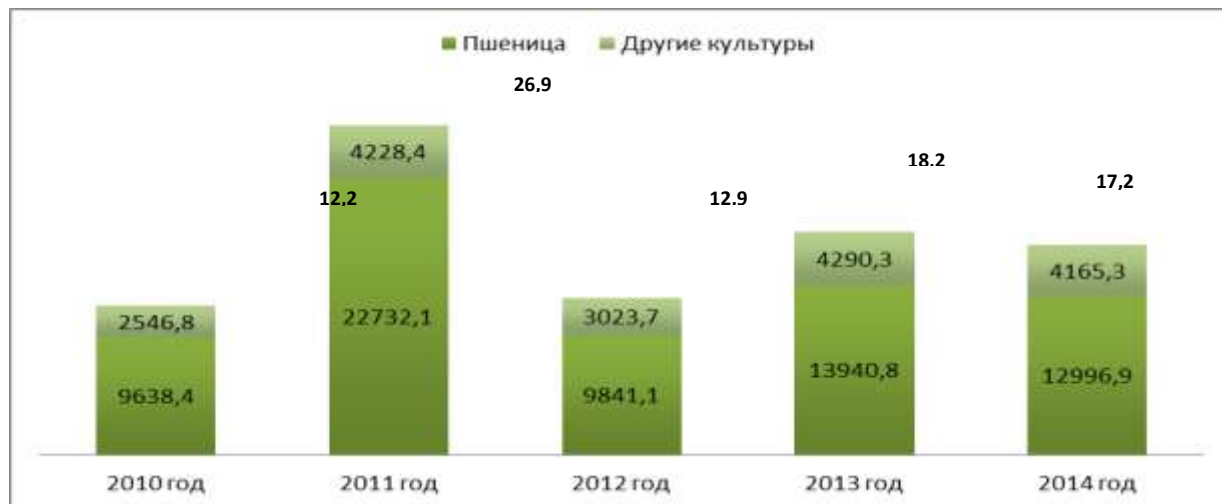
Рисунок 1. Производство зерновых культур в РК в 2010-2014 гг., млн. тонн

Доля пшеницы 1-3 классов в Республике Казахстан составляет не менее 70% валового сбора. Данный товар широко используется многими странами для повышения хлебопекарных свойств производимой муки. Производство зерновых культур в Республике нестабильное, высокоурожайные годы могут резко смениться засухой. К примеру, валовый сбор зерна за последние годы изменялся от рекордно высоких урожаев (2009 и 2011 гг.) до очень низких (2010 и 2012 гг.).