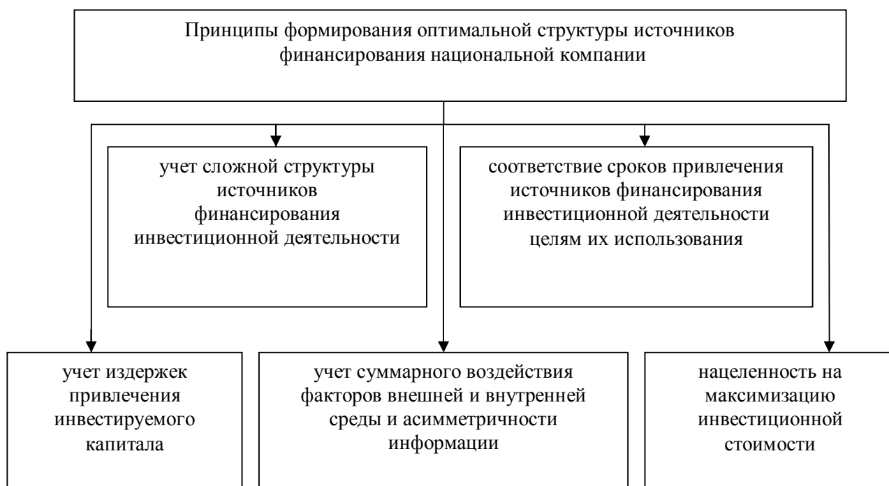
Рисунок 2 - Принципы формирования оптимальной структуры источников финансирования национальной компании

Таким образом, на основе вышеизложенного, можно сделать вывод, что моделирование влияния финансовой архитектуры национальных корпораций на эффективность финансовой деятельности хозяйствующих субъектов позволило определить отдельные детерминанты сложившейся финансовой архитектуры казахстанских национальных компаний, которые играют ключевую роль в обеспечении эффективности финансовой деятельности и формируются под влиянием в-экономических тенденций развития корпоративного сектора. В связи с чем перспективными направлениями дальнейших исследований, по нашему мнению, является разработка практических мероприятий по организационно-экономического совершенствования финансовой архитектуры национальных компаний Казахстана и формирования институциональных условий обеспечения реализации мероприятий на макроуровне с целью повышения эффективности финансовой деятельности отечественных компаний.