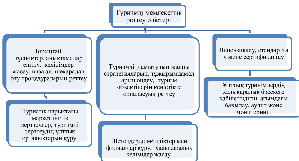
Сурет 1 – Туризмді мемлекеттік реттеу әдістері

Экономика салаларының бірі және бірегейі ретінде туризм саласы да мемлекет тарапынан қолдауды және ең маңыздысы мемлекеттік-құқықтық реттеуді аса қажет етеді. Жалпы тұрғыда туристік саланы мемлекеттік реттеу келесі әдістер көмегімен жүзеге асады (сурет 1).