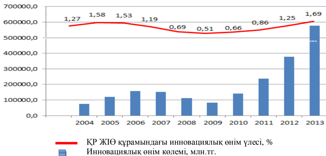
Сурет 1– 2004-2013жж. аралығындағы ҚР-ғы инновациялық өнімнің көлемі, % Ескерту - [1] әдебиет негізінде авторлардың құрастыруы.

2008-2010 жж. инновациялық өнім өндіруде Павлодар облысы жетекші орынды алып отыр (ҚР инновациялық өнімінің 51,1%-ы) 2014ж. – Астана қаласы, Шығыс Қазақстан және Павлодар облыстары.