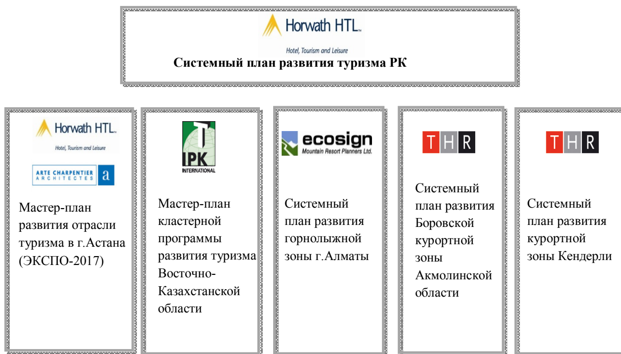
Рисунок 1 – Проведенные исследования потенциала туристической индустрии Казахстана

количество мест размещений и пунктов общественного питания составило увеличилось также в 3 раза (рисунок 1).