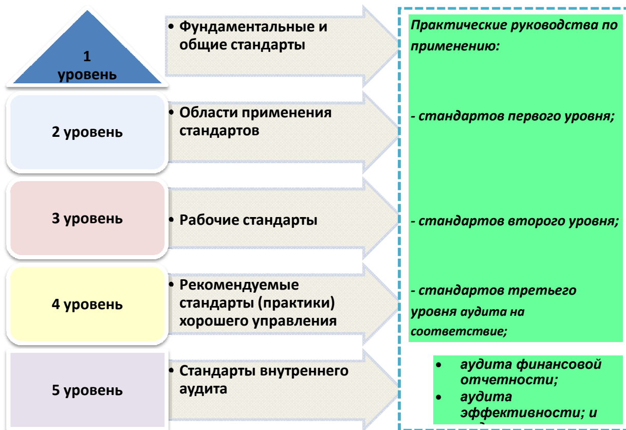
Рисунок 2 – Проект системы стандартов государственного аудита Республики Казахстан

Внедрение государственного аудита в Республике Казахстан согласно вышеуказанной концепции будет осуществляться поэтапно.