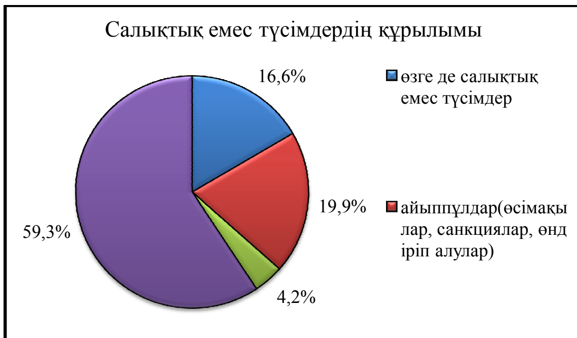
2 - Сурет – Салықтық емес түсімдердің құрылымы

Негізгі капиталды сатудан түсетін түсімдер кірістерде 2014 жылы - 0,3%, 2015 жылы – 0,5%, 2016 жылы – 0,5 % өлшемді алды.