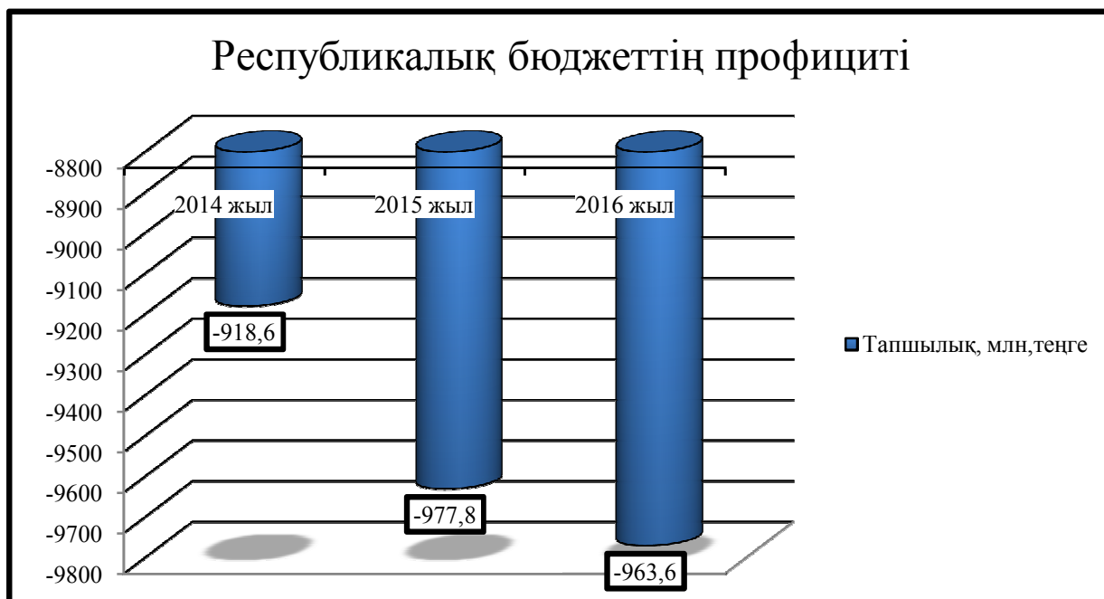
3 - Сурет – Республикалық бюджеттің жетіспеушілігі/профицит

амалдарды жүргізу квоталары негізінде жарналарға жұмсалатын шығыстарда бара-бара көтерілуде. Осы жоспарларға жыл сайын бюджет қаржысының 1/4 бөлігі шығындалады.