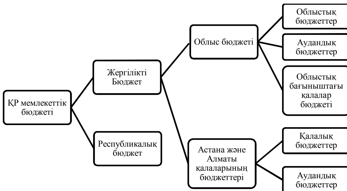
1 - Сурет – Қазақстан Республикасының бюджет жүйесі [3]