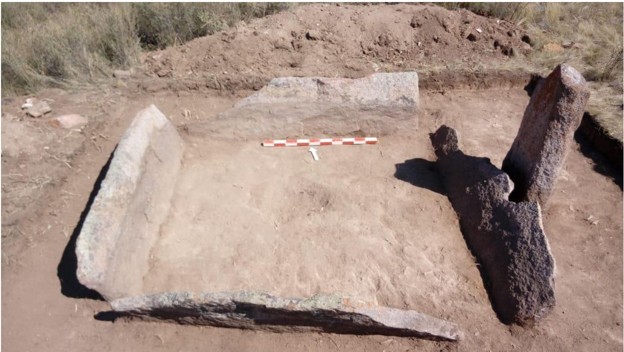
1-сурет. №10 Түркі ескерткіші. Шым қабаты аршылғаннан кейінгі көрініс