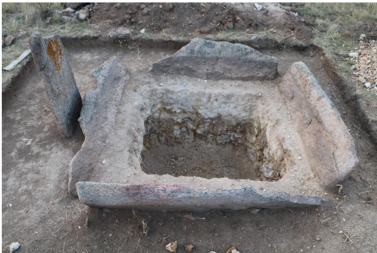
3-сурет. №10 Түркі ескерткіші. Тас мүсіннің сұлбасы