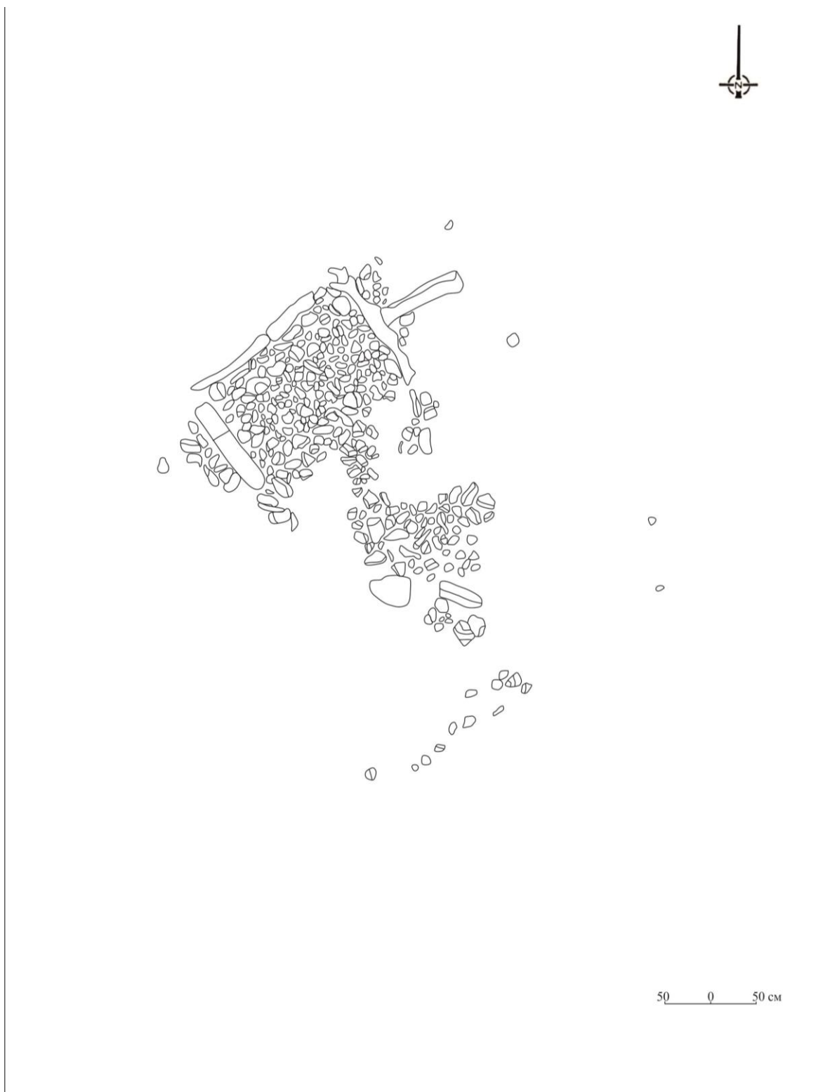
5-сурет. №1 ғұрыптық орын. Жоспары мен кескіні.

Түркі дәуірі бүгінгі ұрпаққа өз мәдениетінің тамаша археологиялық және жазба ескерткіштерін қалдырды. Бұлар қазақ халқының тарихи мұрасы ретінде ұрпақтан-ұрпаққа ауысып, бүгінгі күнге дейін сақталды. Тарихи-мәдени ескерткіштер жазба деректермен үндесіп, сол аймақтың тарихи оқиғаларынан сыр шертеді. Қазірде бұл ескерткіштерді қазақ даласының әр аймағына байланысты кешенді түрде зерттеуде мүмкіндік өте зор және қолға алынып, өз жемісін де бере бастады.