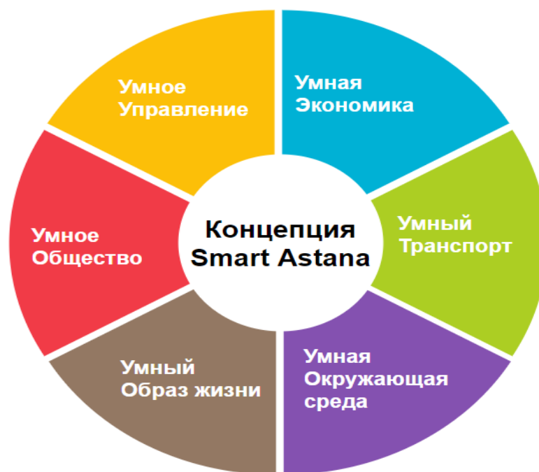
Сурет 1. Smart Astana тұжырымдамасы

Ақылды қала мультиагентті жүйелерден тұрады, бұл сипаттама ақылды қаланың инфрақұрылымы мен қоршаған ортасын құратын жүйелерінде бар ақылды технологияларды қолдануына байланысты. Олар күнделікті қалалық өмірге арналған жаңа шешімдер неғұрлым мүмкін болатындай және оларды қолдану оңай болатындай етіп жұмыс жасайды [7].