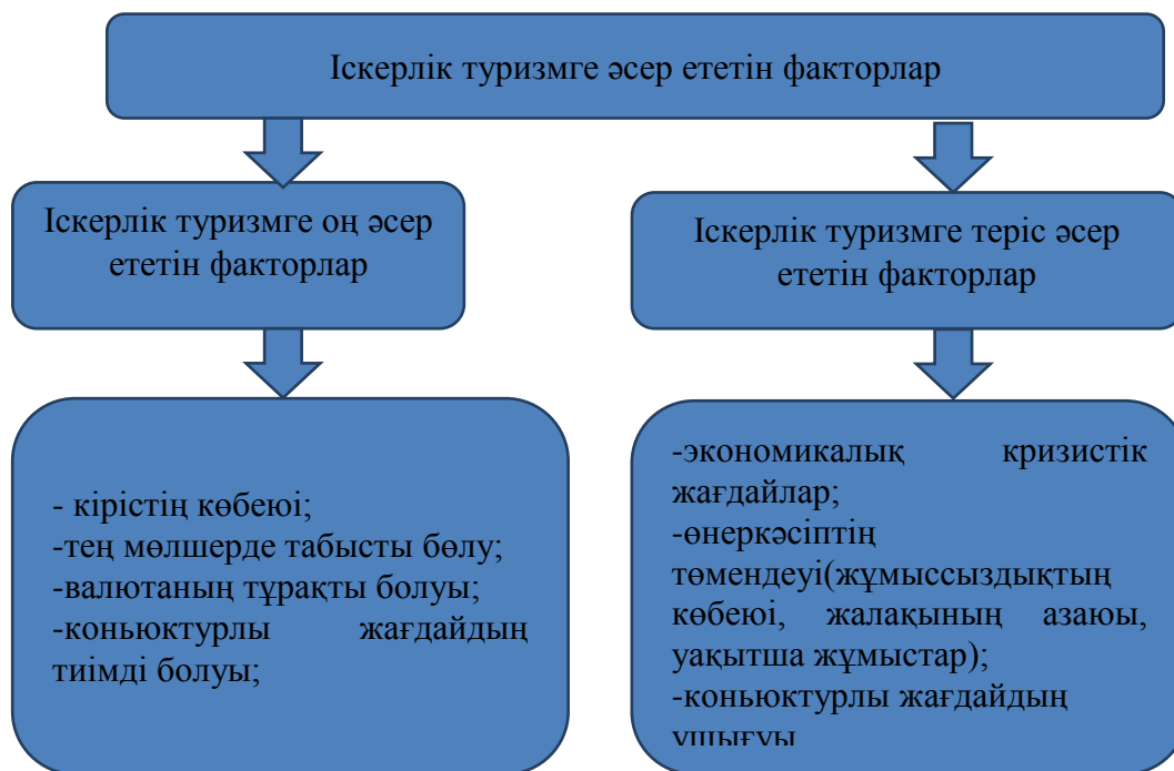
Сурет 3. Интенсивті туризмнің мақсаттары Ескерту – автормен құрастырылған

Кірістің көбеюі туристік қызметтердің пайда болуына себепкер болады. Кірістің көбеюінен тұтынушылар өздеріне көбірек ақша алады. Егер ақша халықты қамтамасыз етуге қажет қаржыдан көп болса, онда сапарға баратын адамдар саныда өседі.