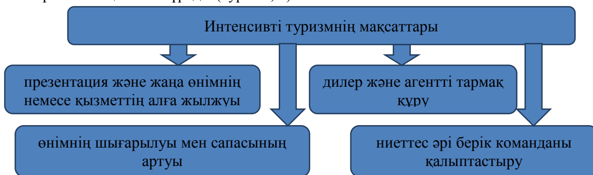
Сурет 1. Интенсивті туризмнің мақсаттары

Іскерлік туризмнің басқа түрі интенсив-турлар. «Incentive» түсінігі ынталандырушы деген мағынаны береді. Осы туризм түріне компаниялардың өзінің қызметкерлерін ынталандыру ретінде ұйымдастыратын сапарларды жатқызамыз, сонымен қатар сырттағы семинарлар, конференциялар мен келіссөздерді айтамыз. Интенсив-турлардың екі түрі бар: жеке турлар; сыртқы семинарлар, конференциялар мен дилерлік мектептер. Интенсивті туризм бірнеше мақсаттан тұрады (сурет 1, 2):