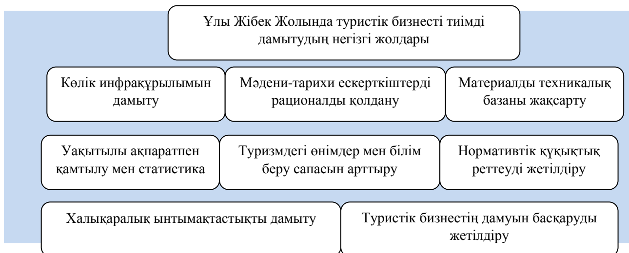
Сурет 1. Жібек Жолында туристік бизнестің дамуын мемлекеттік қолдау бойынша іс-шаралар

Ескерту - [1] мәліметі негізінде автор құрастырды