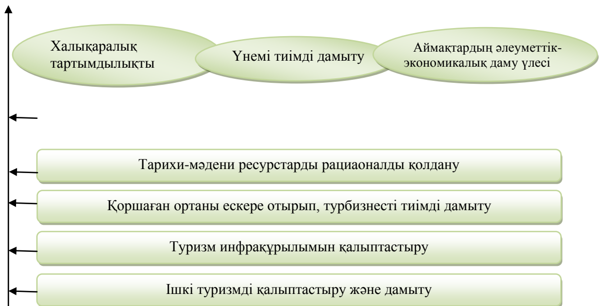
Сурет 2. Ұлы Жібек жолы бойында туристік кәсіпкерлік қызметті дамыту саласында халықаралық ынтымақтастықты жетілдіру бойынша ұсыныстар Ескерту: [4] мәліметі негізінде автормен жасалды

Жібек Жолы үлкен әлеуетке ие және туризм бағыты бойынша ерекше бағыт ретінде дамуына мүмкіндік береді, туристік ресурстардың бес ел арқылы шекаралық және аудандық инвестициялық мүмкіндік береді. Жібек Жолын ең үлкен туристік әлеуеті ретінде мәдени және тарихи көрікті жерлер мен экотуризмді дамыту болып табылады. Қазақстанның туристік әлеуеті барлық туризм түрлерін дамыту үшін: мәдени, шытырман, танымдық, спорттық, экологиялық, сол сияқты арнаулы турларға қызығушылық туғызу (ғылыми, діни, орнитологиялық және т.б.). мүмкіндігі бар. Қазақстан туристік бизнесті дамыту болашағы бар. Дамуды жоспарлау, реттеу, координациялау және бақылау сияқты нақты жобаланған жүйе арқылы дамытуға үлкен мән беріледі. Жібек Жолында туристік кәсіпкерлік қызметті дамытудың мемлекеттік реттеу жолдары ұсынылды.