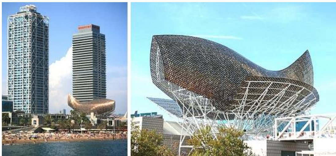
Рис. 2. Памятник архитектуры «Кит», Барселона, 1992 год

В 1992 году в г. Барселона (Испания) проходили XXV Летние Олимпийские игры. При подготовке к этому значимому событию было принято решение о создании необычной скульптуры в виде рыбы на береговой линии Олимпийской деревни, реализацией проекта занялся архитектор Фрэнк Гери (рис. 2).