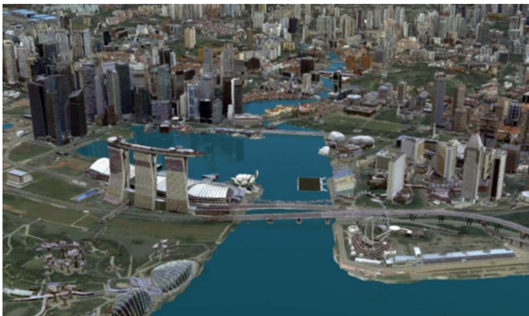
Рис. 3. Информационная модель г. Сингапур

Анализируя полученные результаты, отметим несколько факторов, которые можно сформулировать следующим образом: