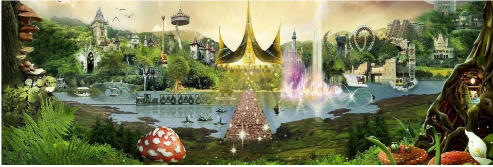
Сурет 2. Қиял ғажайып саябағының жобасы

Сонымен тақырыптық саябақтар дегеніміз – құрылымдарының барлығы ортақ тақырыпта біріктірілген, жасанды құрылған танымдық-ойын-сауық парктері. Бір қарағанда олардың басқа парк түрлерімен ұқсас жақтары көп, алайда, құрамдық элементтері жағынан және ұйымдасу мен қызмет етуі жағынан ерекшеліктері айқын. Әлемдегі тематикалық парктер мен еліміздегі дәстүрлі мәдениет және демалыс парктерінің арасында айырмашылық бар. Тақырыптық ойын-сауық саябақтары алдыңғы қатарлы технологиялар мен жаңа ғылыми жетістіктердің негізінде құрылып жұмыс жасайды. Ғылым мен техника саласындағы соңғы әзірлемелерге, сонымен қатар жаңа технологиялық шешімдерге жоғары назар аудару тақырыптық саябақтарды ірі университеттердің жанынан ашылып жатқан инновациялық орталықтар – технопарктермен соншылықты жақын етеді. Алайда аталған екеуінің де түптің-түбінде атқаратын қызметтері бойынша бір-бірінен айырмашылықтары бар. Бәрінен бұрын тематикалық парктер мен классикалық көңіл көтеру парктерінің ара-жігін ажырату қиын. Тақырыптық парктер олардың қызметінің сан алуан болуымен ерекшеленеді, соған сәйкес, көп профильділікке де бейім. Тақырыптық саябақтарда бірмезгілде бірнеше бағыттар бойынша машықтанады, ең алдымен көңіл-көтеру, мәдени-танымдық және білім беру бойынша. Машықтану бағытының кеңеюіне парктік анимация ықпал етеді. Ол адамға қажетті бірқатар қызметтерді орындаумен ерекшеленеді: