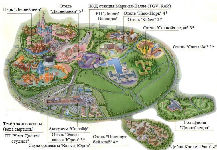
Сурет 2. Туристік тематикалық парктік кластер Марн-ля-Валле (Франция)

бетіне» аттауға болатын, сондай-ақ қызықты триллер немесе боевиктердің әрекеттегі кейіпкері болуға мүмкіндік беретін жалғыз саябақ. Мәселен, үшөлшемді фантастикалық «Терминатор» шытырман оқиғасына қатысып, «Хичкок» қорқыныштар әлемінде болып немесе «Челюсти» фильміндегі алып акуланы жеңсеңіз болады. Орlando маңайында орналасқан «Буш Гарденс» саябағында соңғы модификациялардағы күрделігі жоғары топқа жататын «америкалық горкалар» (айналысы 360°) орналастырылған. Америкалық тематикалық саябақтардың бірі «Си Уорлд» саябағында жақында «америкалық горкаларда» сырғанау арқылы керемет, ұмытылмас әсер қалдыратын голографикалық спецэффекттермен және жап-жаңа лазерлі технологияларды біріктірген «Антарктидаға саяхат» атты ғажайып аттракцион ашылды.